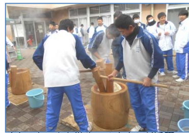
もちつきでは中学生のみなさんが活躍