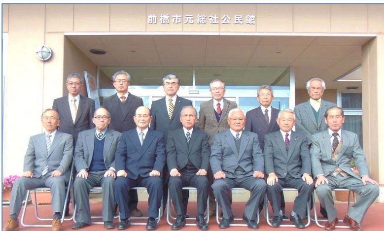
前橋市元総社公民館