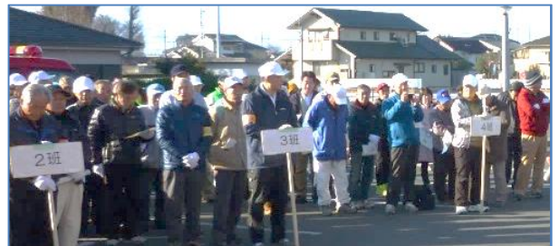
当日は早朝から多くの方にご参加いただきました

昨28年は災害が多く、震度7を2度記録した4月の熊本地震をはじめ、10月の鳥取県中部地震等が発生、その他各地で大雨・台風被害も生じました。12月22日には、新潟県糸魚川市の大火で約150棟が焼失しています。さまざまな災害を想定した防災対策、避難準備を、日頃から心がけていただきますよう、改めてお願いします。