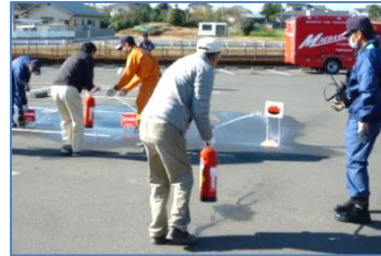
練習用消火器で緊急消火訓練