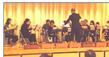
「アンサンブル響」さんによる演奏会