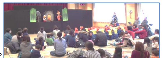
「おはなしの会もこもこ」さんの人形劇「ヘンゼルとグレーテル」上演。こどもたちや施設通所者のみなさんから大人気でした

今回も市内で活動する「おはなしの会もこもこ」のみなさんがお越しください、人形劇「ヘンゼルとグレーテル」「たぬきのジロちゃんタロちゃん」を