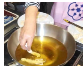
第2回講座（12月2日）から。素朴で懐かしい味の田舎かりんとうを揚げました