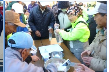
炊き出しの調理袋に米と水を詰めます