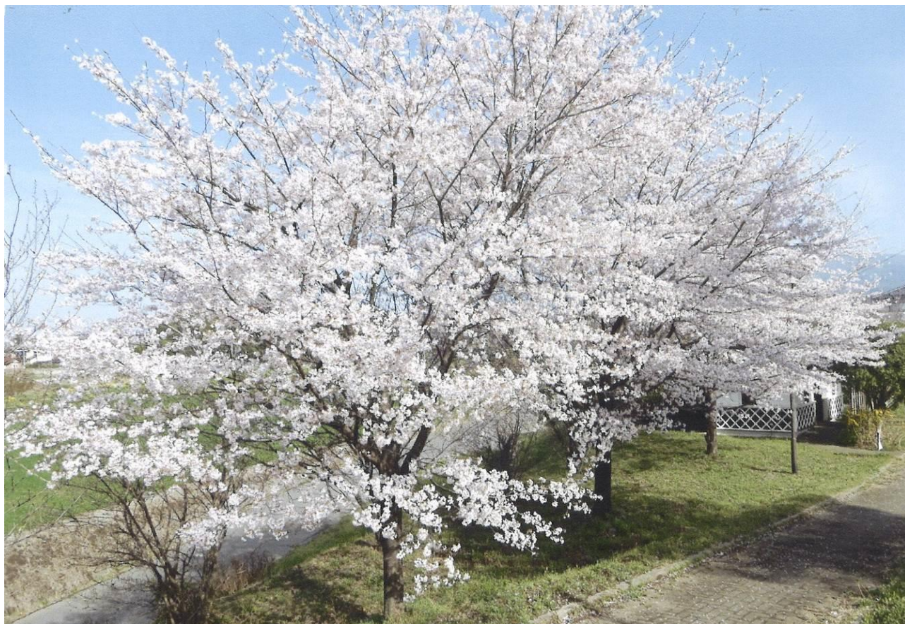
女渚城址公園（粕川町女渚）