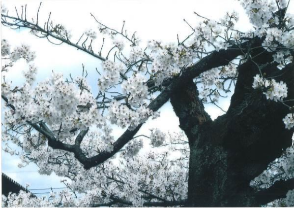
け 上佐鳥町公民館

今年は冬から春にかけて異常なまでの高温が続き、桜の開花も昨年と比べ1週間も早く咲きました。この報告書を作っている今日(3/24)は樹齢72年の歳月を経て、頑張っ、咲き誇っている桜吹雪が見事です。(隊員番号29)