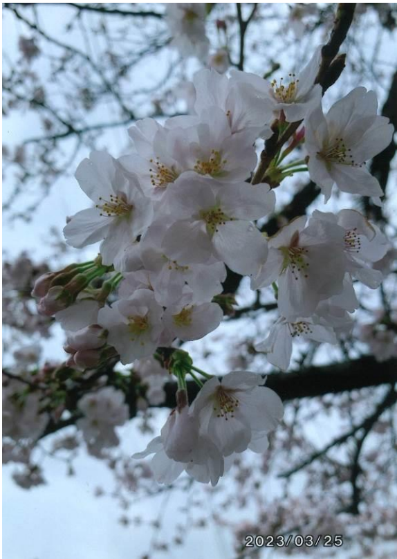
ん 観音堂 (箱田町)

今年はいよいよとあたたかくなり桜もびっくりしているのではないのでしょうか。前橋市の開花宣言が3/18 雨の日でしたね。その後、観音堂の桜が3/20に開花しました。三寒四温を繰り返しながら3/25には満開となっていました。今年も美しい桜をめぐる事が出来て幸せです!! (隊員番号 25)