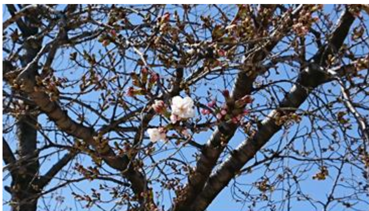
そ 天川原中央公園

桜の花の開花直前は、それまでのつぼみの成長の様子と違って、急激に成長するということが興味深いと思いました。(隊員番号 30)