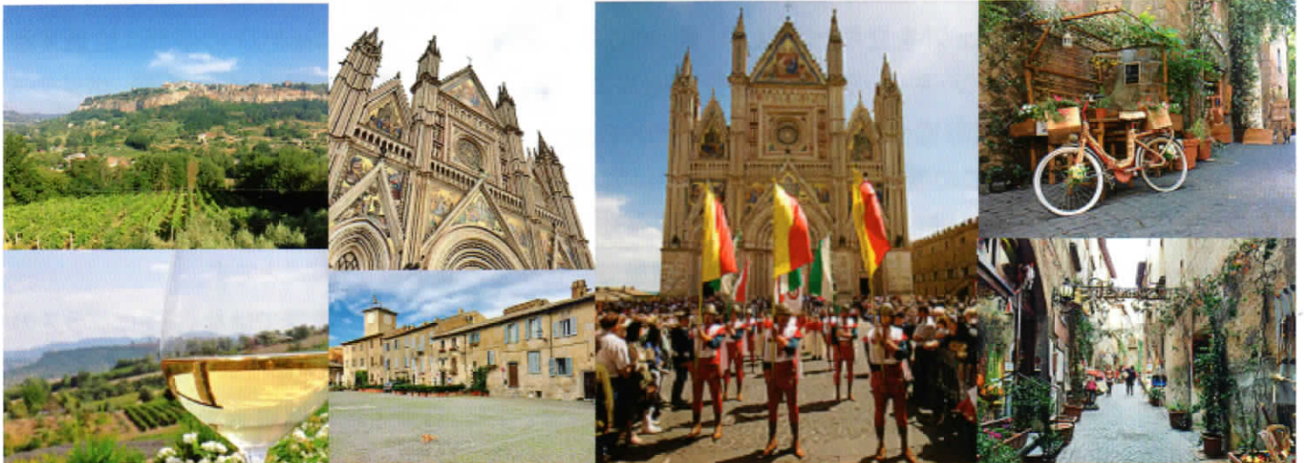
歴史文化を誇り、市民の健康や環境を大切にしながら、スローライフや食生活を楽しむことのできる街

1999年に発足したスローシティ国際連盟の本部を置き、「スローライフ」や「スローなまちづくり」の首都として、美味しいワインや良質な農産物、豊かな自然や人に優しい環境、まちなかの活性化と伝統産業や手工業、そして素晴らしい歴史的な建物などを守っていきます。