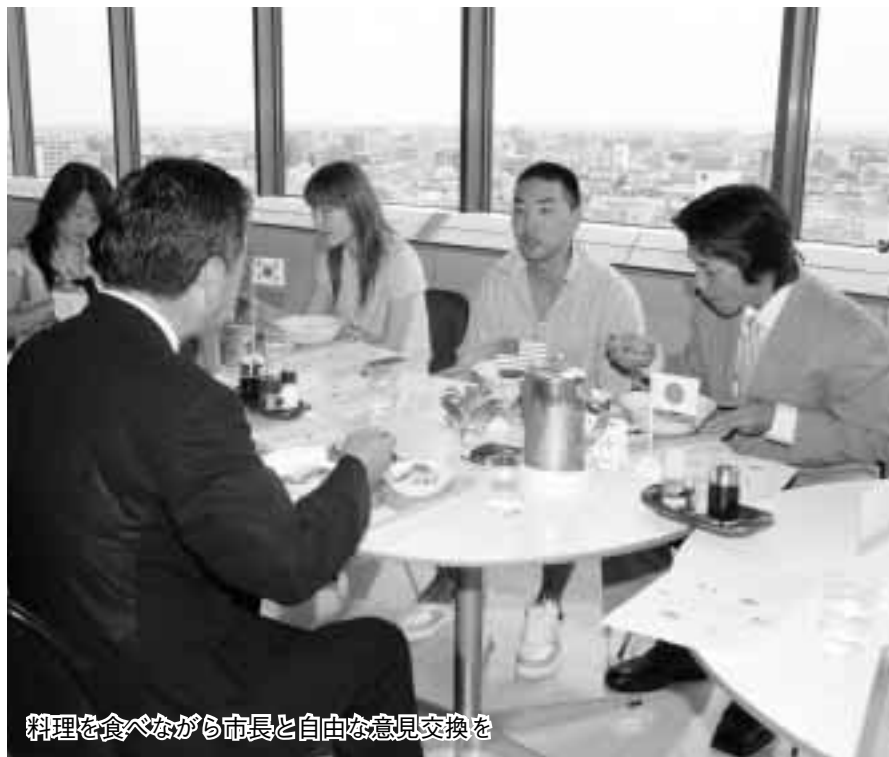
料理を食べながら市長と自由な意見交換を