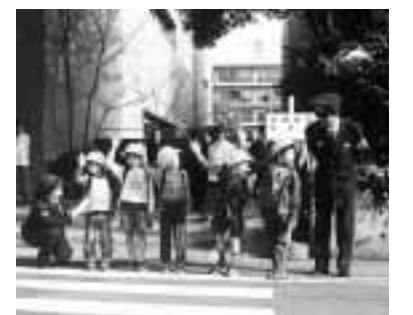
右見て左見て横断を

四月九日(月)から十五日(日)まで、「新入学(園)児童・生徒の交通事故防止運動」が実施されます。通学などに不慣れた新入学(園)児童・生徒を交通事故から守る思いやりを市民一人一人が持ち、交通ルールとマナーの実践を習慣付けましょう。 子どもたちが交通ルールと学びたい人を支えるため 「奨学金制度」があります 対象 〓 次のすべてを満たす高校・高専・専修学校の高等課程に在学中の人 ①経済的な理由で就学が困難 ②品行方正、身体健全、学業優秀 ③他の育英や奨学金の貸与・給与を受けていない 貸与月額 〓 国公立 〓 一万二千元(私立) 〓 一万八千元 貸与期間 〓 4月から卒業まで(最短修業年限) 返還方法 〓 卒業後六カ月から十年間で年四期に分けて返還(無利子、一括・繰り上げ返還も可。大学・短大など上級学校へ進学した場合は、在学期間中の返還延期も可) 申し込み 〓 4月20日(金)までに在学する各学校へ 〇: 問い合わせは学校教育課 ☎ 890-5812へ。