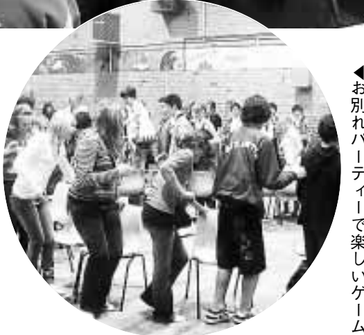
◀お別れパーティーで楽しいゲーム

オーストラリアでホームステイなどを体験する海外研修生を募集します。実践的な語学研修をしてみませんか。 研修期間 〓 8月3日(金) 〓 17日(金)の十五日間(事前研修は6月2日(土)・7月9日(月)・23日(月)・28日(土)、帰国報告会は10月27日(土)) 研修先 〓 シドニー(オーストラリア) 対象 〓 保護者とも市内在住の中学生(大胡中・宮城中・粕川中を除く)・ 高校生で次の条件を満たす十人(選考)。 ①地域の青少年・奉仕活動や生徒会活動などを積極的にしている ②帰国後、派遣体験を生かし国際交流事業やホームステイの受け入れなどに協力できる ③研修やホームステイへの適応能力や意欲がある ④保護者の承諾がある ⑤基本的な英会話力がある ⑥長期海外生活経験がなく、本事業や国・地方公共団体が 行う同種の事業に参加したことがない 内容 〓 ホームステイ、現地の学校での英語研修や交流活動 参加費 〓 十二万円 選考会 〓 5月7日(月)午後1時30分、総合教育プラザ 申し込み 〓 4月23日(月)までに所定の用紙に記入し、〒371-0035前橋市岩神町三丁目1-1 総合教育プラザ内 青少年課「教育係」(☎231-5138)へ