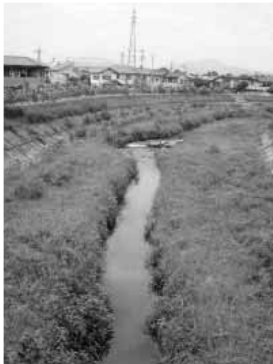
きれいな河川を守ろう (赤城白川)

浄化槽設置工事費と住宅用太陽光発電システム設置費を補助します。補助金を受けるには、工事着工前に申請し、交付決定を受けることが必要。必ず事前に環境課へ問い合わせてください。 なお、申し込みは先着順で受け付け、予算額に達した時点で受け付けを終了します。 □浄化槽設置費の一部補助 下水道などの整備予定がない地域(一部下水道認可区域含む)で、一般住宅や店舗併用住宅(居住用部分が二分の一以上)に浄化槽を設置しようとする個人に補助を行います。 対象 〓 来年3月31日(月)までに工事を完了し実績報告書を提出できる人 補助金額 〓 五 人槽 〓 十五万円以内 〓 六・七人槽 〓 二十万円以内 〓 八〓 十人槽 〓 二十五万円以内 〓 既存単独処理浄化槽などからの転換加算 〓 三十万円以内 申し込み 〓 12月21日(金)までに環境課へ直接 助 □太陽光発電設置費の一部補助 住宅用太陽光発電システムを設置する個人に補助を行います。 対象 〓 来年3月31日(月)までに工事を完了し、電力会社と受給契約を締結して実績報告書を提出できる人 補助金額 〓 一〇〇万円以内 〓 一〇〇万円以内) 申し込み 〓 12月21日(金)までに環境課へ直接 〇: 問い合わせは同課 ☎ 890-6292へ。