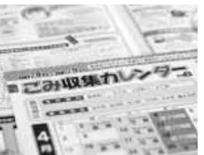
収集日など確認しましょう

本紙3月15日号とともに各世帯へ配布した「ゴミ収集カレンダー(上半期)」は、市役所清掃業務課、各支所・出張所・コミュニティセンターにも置いてあります。また、本市ホームページからダウンロードすることも可能です。カレンダーには四月から九月までの家庭ゴミ収集日のほか、裏面には分別のポイントなども掲載しています。 住みよいまちにするため、ゴミは収集日や分別方法を必ず確認し、決められた日の午 環境について体験学習を 「子どもエコクラブ」など 「子どもエコクラブ」は、子どもたちが環境について自由に活動するクラブです。高校生以下が二人以上と大人のサポーターが一人いれば、いつでも無料で登録できます。なお、活動内容は次の二つ □エコロジカルあくしよん 生き物の調査や町のエコチエックなどで各クラブが自由に行う活動です。 □エコロジカルとれーにんぐ 全国事務局から送られてくる子どもエコクラブニュースの中で紹介されるもので、毎日の生活の中から、地球や環境のことを楽しく考えるプログラムです。 〇: 問い合わせは環境課 ☎ 890-6292へ。