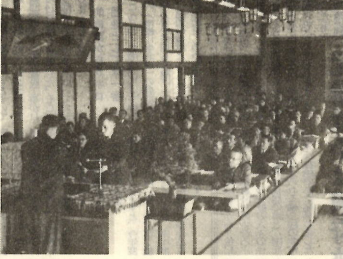
(写真は公民館で行なわれた農業共進会の表彰式)

せむしかつ農作もいよいよ12月9日午後1時から、この一年間に行なわれた農業関係の5つの共進会の表彰式が市民会館で盛大に開かれました。 5つの共進会は、第1回共進会、梨共進会、第2回畜産共進会、水産共進会、年間条収共進会共進会です。受賞者は24人の汗の結晶がこの栄えある受賞となったものです。表彰式はこれらの共進会をまとめて、農閑期に入つたこの日に行ない、その栄を一堂に集めたいとするもので、神田知事、石井市長から賞状を受ける受賞者の方々は、この日を特別な喜びで、またに幸せうな一日でした。以下、新聞の関係で掲載してお知らせします。