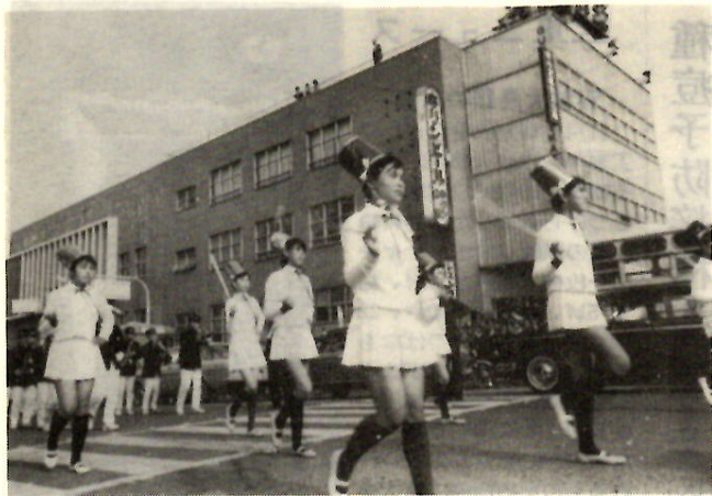
前橋まつりおわる