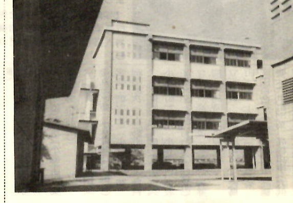
市立女子高校に「芸術館」 書道、美術、音楽など芸術関係の学習を1つ建物にまとめ、能率的に情操教育を高めようと、県下初の施設が市立女子高校にお目見得しました。概要は鉄筋四階建の独立校舎で総工費2千万円。一階は通路で2階書道、三階美術、四階音楽各教室に準備室、倉庫がつけ四つのピアノ練習室があります