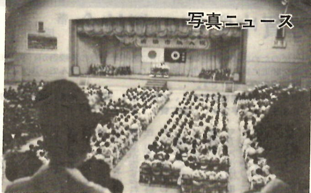
写真ニュース 第18回 成人祝 (該当者3345名) スポーツセンターで開催