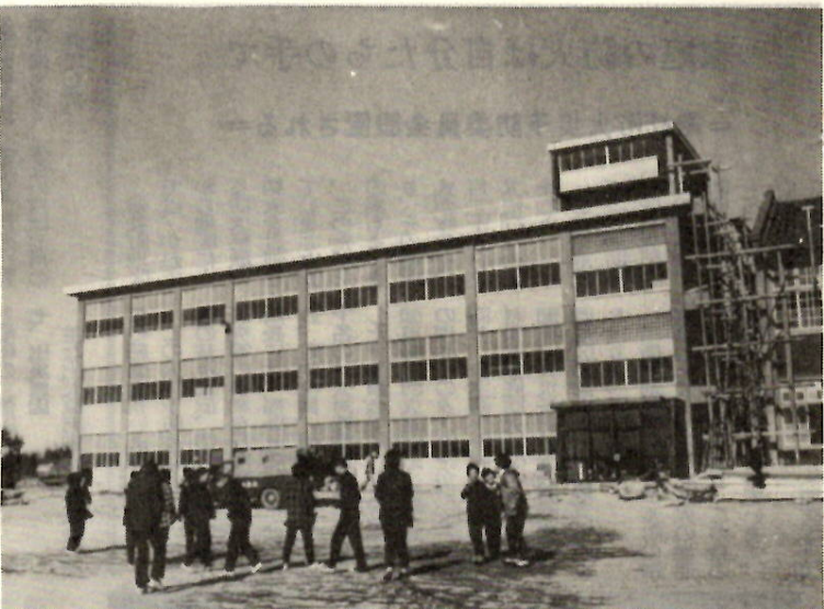
芳賀中学校の新校舎落成

上下水道も順調な伸び 上水道 このほ市の水道局では、四十年の前期すなわち、四月一日から九月三十日までの上水道及び下水道事業の業務状況を次のとおり公表したので、そのあらましをお知らせいたします。 ▼事業のあらまし 九月末の水道普及状況をみますと、上水道・簡易水道をあわせて給水人口は、十七万二千四百八十八人と伸びました。その給水世帯数は、四万二千七百七十七世帯です。これを前年九月末と比較すると、給水人口は、二千四百七十七人、給水世帯数は、三千四百七十七世帯の増加となっております。この普及率は、八八・三%で、全国的にもまれにみる普及率です。これ、市が積極的に水道拡張工事・給水区域の拡大、さらには、給水事業の奨励措置によるものと思えます。 次に建設工事においては、年々給水需要の増加と、将来計画を考慮し、水源確保に重点をおき、今期川原町地区内に十一号井・十号井を完成し、新たに二万立方尺を確保し、これと平行して配水管の布設工事も積極的に進め、市内の水圧増強と給水区域の拡大に努めてまいりました。 この結果、九月末までの配水管延長は、三万八千六百六十三十四尺に達し、ちよと前橋から東京を経て東海道線では、豊橋付近、東北線では、平泉まで延伸しております。前年九月と比較しますと三万四千四百一十尺の増加となっております。 ▼経費の状況 はじめに収益の収入及び支出は、水道事業収益計算繰額十七万七千九百八十八万円を記録しました。これは一日平均四万七千四百四十九立方尺という配水量にて、収入調定額は、一億五千八百