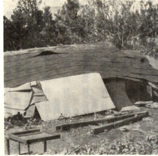
本市被害に 台風26号の 災害救助法が発動