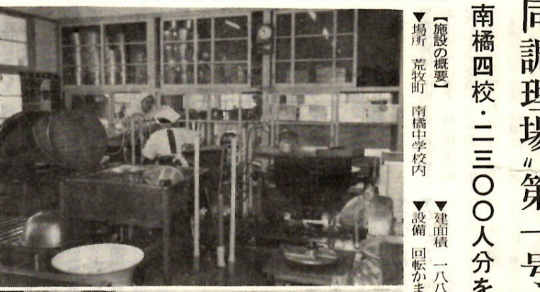
【施設の概要】 ▼場所 荒牧町 南橋中学校内 ▼面積 一八八・六平方 ▼設備 回転車(六基) 洗滌 槽

学校給食の合理的 運営を目的とし た、本市第一号の 「学校給食共同調 理場」ができあが り十一月十六日か ら運転を開始しま した。