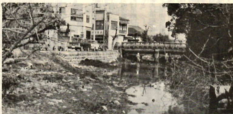
↑ 改修前の広瀬川・川の中にゴミと土砂が山積されていました ← 改修後本来の美しさをとりもどした広瀬川の流れ