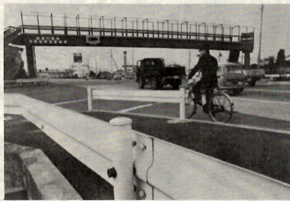
高前バイパスの元総社横断歩道橋

人間の欲望は無限がありません。しかし、ささやかな幸せを願うことは、市民として当然のことです。ささやかな幸せとは一体何でしょうか。周囲の温かい愛情によって育まれた幸せ、五体満足で、すこやかでありたい。このささやかな幸せまでも、一瞬にして奪ってしまうのが交通事故です。 柱ともたのむ主人が、代わるものならわが身を頼りて愛児が、骨をくだかれ、血を流し、後遺症に日夜悩まされるご家庭。これが交通事故の惨状です。歩行者は安全に歩くことに、運転者は安全に運転することに専念し、「秋の交通安全運動」を機会に、交通事故のないあかるいまちになるよう、ご協力をお願いします。