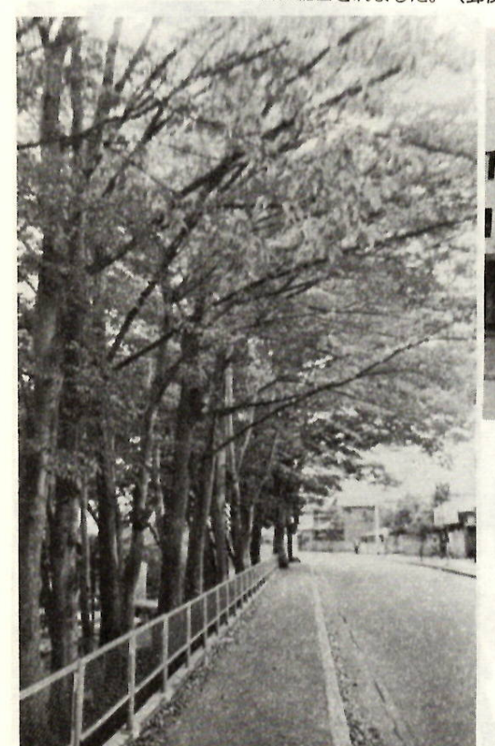
児童遊園地のケヤキ並木が、し だいに色づきを増して、道ゆく人 びとの眼に、 "深秋" の気配を感 じさせているきょうこのごろです