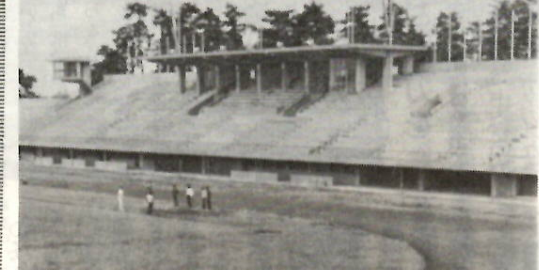
総体主会場となり総合開会式が行なわれる県営陸上競技場