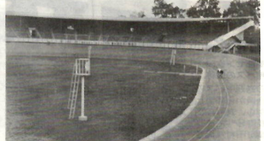
自転車競技の会場となる競輪場