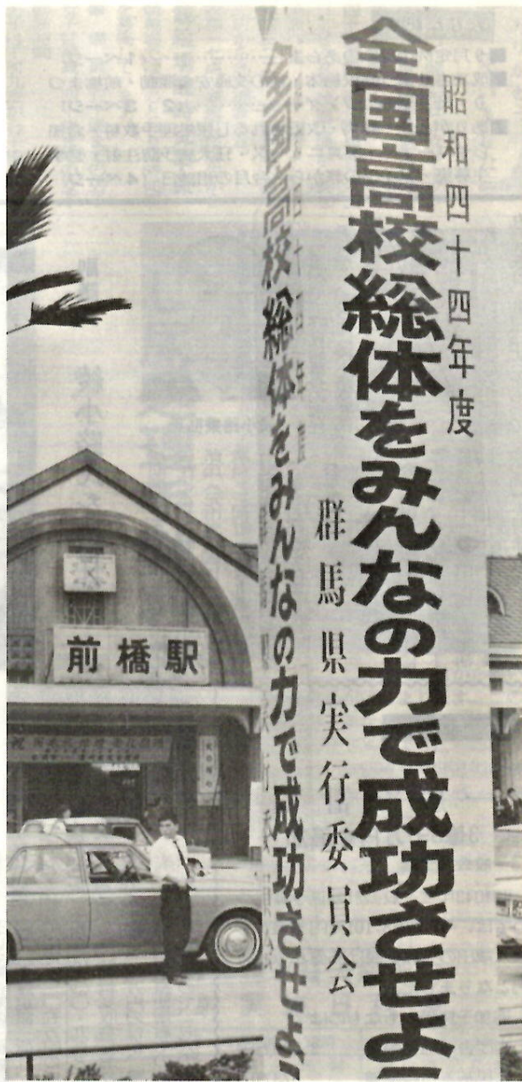
高校総体の協力をよびかける宣伝塔…前橋駅前