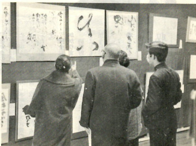
昨年の市民展から