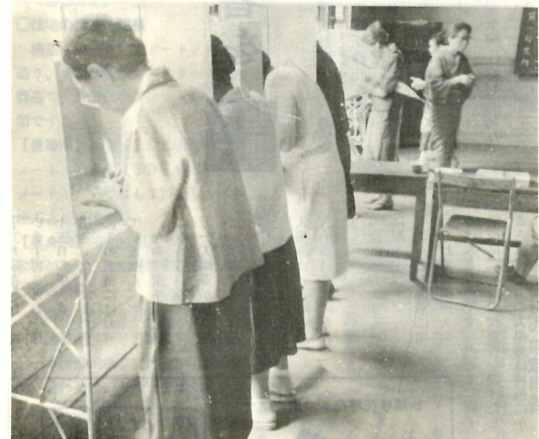
あなたの一票を市政へ (昨年の参院選から)

たいせつな一票をムダにしないよう 投票するときは、候補者の氏名だけを、はっきりと書いてください。だれに投票するかは、あなたの自由であり、その投票の秘密は絶対に守られます。 × × × 開票にあたって、最も大きな問題は、投票の有効が無効かということを決めることです。このことは、開票管理者が開票立会人の意見をきいて決定しますが、無効とされる投票には、次のようなものがあげられます。 ①正式の投票用紙を使っていないもの。 ②候補者でない者の氏名を書いたもの。 ③一枚の投票用紙に二人以上の氏名を書いたもの。 ④候補者の氏名のほかに、余分なことを書いたもの。ただし、職業、身分、住所または敬称などを書いたものは有効です。 ⑤どの候補者にしたのかわからないもの。 ⑥なんにも書かないで投票したもの。 ⑦記号や符号などを書いたもの。