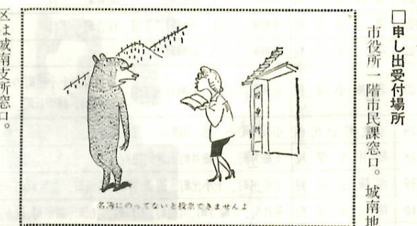
名簿にのってない投票できませんよ

公職選挙法の規定によって、選挙人名簿の三月定時登録をいたしますから、次に該当する人は必ず三月一日までに印かんをもって、市役所へお出かけのうえ、登録の申し出をしてください。