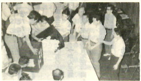
開票は5つの開票所で午後7時から行なわれます

明るく正しい選挙を実施するために、選挙運動に関係する候補者、運動員、後援会、政党はもちろんだら、投票を行なう選挙人も、この選挙のルールにしたがわなければならない。そこで、市選運動を中心に、選挙運動のルールをあらわしをお知らせします。