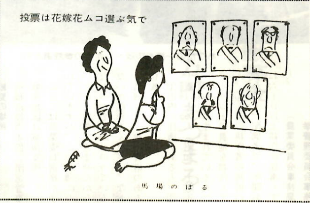
投票は花嫁花ムコ選ぶ気で

市内で住所を変えた人で、一月二十六日まで市役所へ住所移動の届け出をした人については、新しい住所の投票所で投票ができる