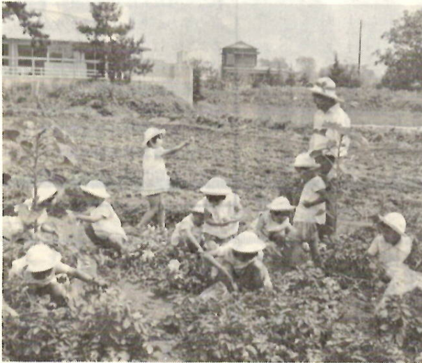
せんせい、こんな大きいイモが掘れたよ！幼稚園 の畑で楽しいイモ掘りに大はしゃぎの園児たち。

小動物の飼育や教師の研究は神明・若宮幼稚園と同じですが ② 総社小の併設幼稚園・園長は総社小の校長が兼務、全園児がそのまま総社小へ入学するという、幼小一貫の理想的な幼稚園です。 ③ 家庭的な幼稚園・四学級という家庭的な幼稚園で、幼児は落ちついたふんい気度教育がうけられるよう配慮されています