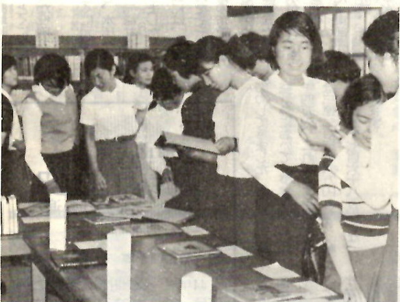
▲毎月1回「本の集い」がひらかれます。山の本・料理の本・住いの本などを展示し、講師を招いて講演会もひかれています。「本の集い」に集った若い人たちが