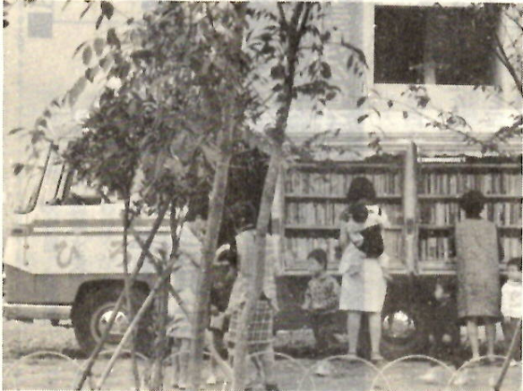
▲1,200冊の本を積んで、月1回全市域を巡回している動く図書館「ひろせ号」巡回時間が待ちきれないようにして集ってくる近所の主婦や子どもたち。

■新聞・雑誌展示と講演会 ▽とき 10月25日(土)〜26日(日) 午前9時〜午後4時(25日) 午後1時から(26日) 市立図書館・高校生室▽内容 明治・大正・昭和の新聞、雑誌の展示 ■講演会 ▽とき 10月26日(土) 午後1時から 市立図書館・高校生室▽内容 明治・大正・昭和の新聞、雑誌の展示 ■講演会 ▽とき 10月26日(土) 午後1時から 市立図書館・高校生室▽内容 明治・大正・昭和の新聞、雑誌の展示