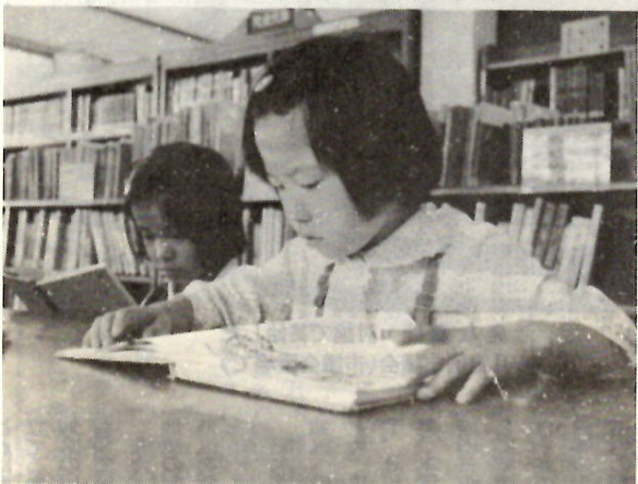
▲ちかごろの子どもは本を読まない、とよくいわれますが、図書館へくる子どもたちはなかなかの読書家ぞろい。子ども室の開館前には、いつも100人以上の子どもが列をつくるほどです。