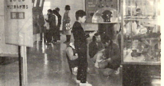
▲資料展示室には、毎日たくさんの子どもたちが学習に訪れます。地球の誕生や宇宙のしくみに人気が集まっています。(児童文化センター3階で)