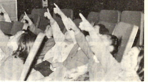
▲プラネタリウムで星のようすをみつめるよい子たち。あゝ、北極星が見える。(児童文化センター4階で)