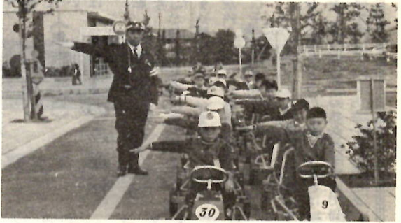
▲足踏みゴーカートによる交通訓練。よい子たちも真剣です。(交通公園で)

■二千年後の星も見えるプラ ネタリウム 児童文化センター四階にあるプ ラネタリウムは、惑星儀とか天象 儀とかいわれ、丸いドームに人工 的に天体の複雑な動きを投影して 説明する機械です。ここに備えら れたのは、32個のレンズに恒星三 千個余りをうつす恒星球と、太陽 月、惑星などをうつす惑星投影器 からできています。これはか宇宙 ロケット、人工衛星、日食、月食 流星、太陽系、オーロラ、コメッ