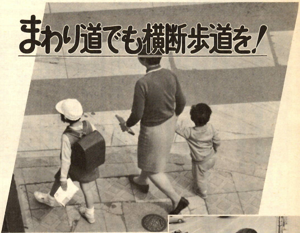
左右をたしかめ、必ず合図をして渡りましょう