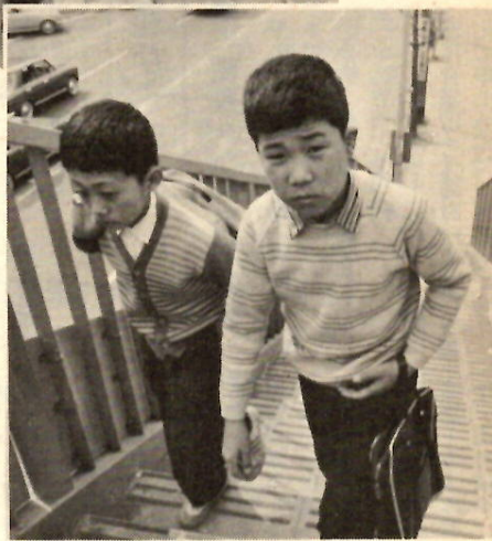
歩道橋のあるところでは必ず、歩道橋を……