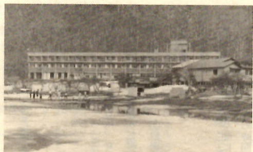
赤城大沼湖畔に完成した国民宿舎「赤城緑風荘」

この国民宿舎は、鉄筋の三階建て、モダンな建物です。料金は一人一泊二食つきで、おとな千二百円、中学生千円、小学生九百円です。 どうぞ、ひろくみなさんおさそい合わせて、レクリエーションに活用し、また家族のいこの場にご利用ください。 申し込みは予約受付をご利用ください。電話による予約は、前橋局(〇二七)三二一五二一内線六二と三番です。