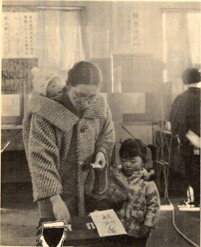
あなたのたいせつな一票を市政へ——(昨年の参議院選挙から)