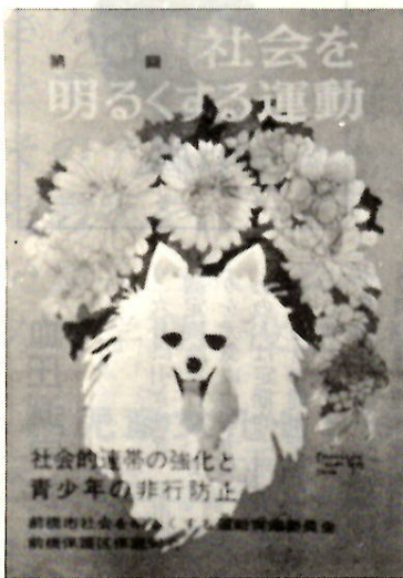
社会を明るくする運動ポスター

七月一日から一か月間、全国的 に「社会を明るくする運動」が展 開されます。この運動は、すべて の国民が犯罪の防止と、犯罪をし た人たちの更生について理解を深 め、みんながそれぞれの立場にお いて力を合わせ、犯罪のない明 い社会を築こうとする全国的な運 動です。 ことは、「社会的連帯の強化 の座談会など。