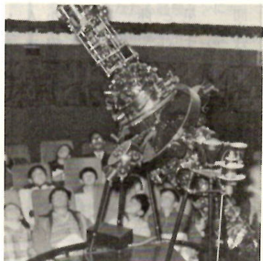
プラネタリウムで星のべんきょう