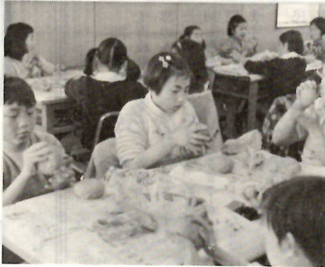
造形教室で楽焼をしているよい子たち

小中学生のみなさん、そしてパパさん、ママさん。……もうすぐ夏休みですね。いろいろと楽しいプランをたてていることでしょう。そのプランのなかに、児童文化センターの学習教室を、ひとつ加えてみませんか。たのしいふんい気、ためになる自由研究——みなさんの学習に役立つ内容でいっぱいです。