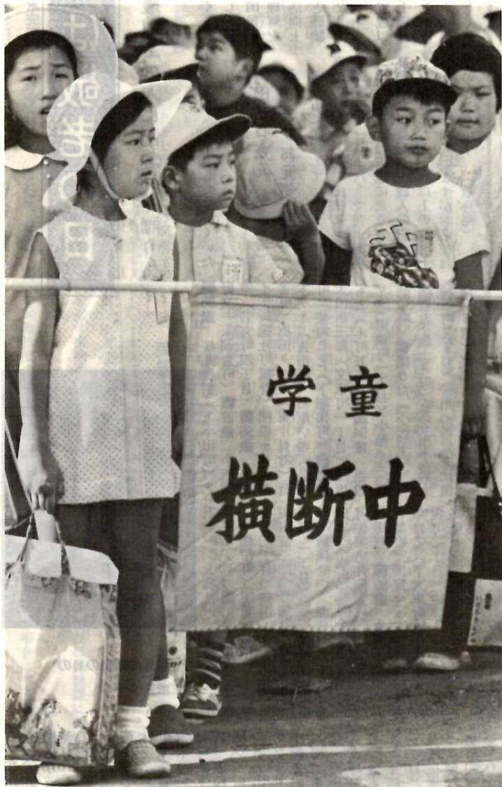
交通戦争なんかには負けないぞ