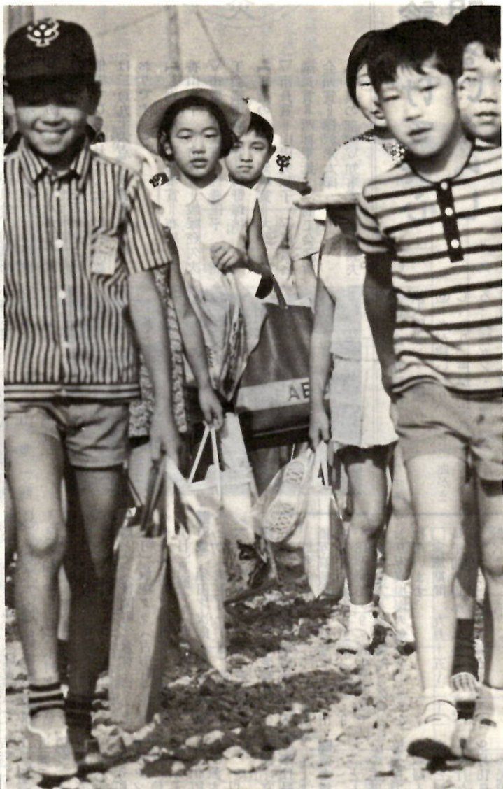
日やけした黒い顔・顔 みんな元気だった