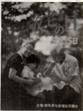
写真は敬老の日のポスター