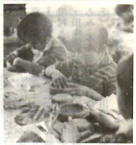
児童文化センターの造形教室でねんど細工をしている児童