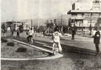
自転車の検定を受けているよい子たち

西片貝町にある児童文化センターでは、小中学生を対象に、十二月二十七日全国の公立施設としてのはじめの、「自転車の安全な乗り方検定」を実施しました。