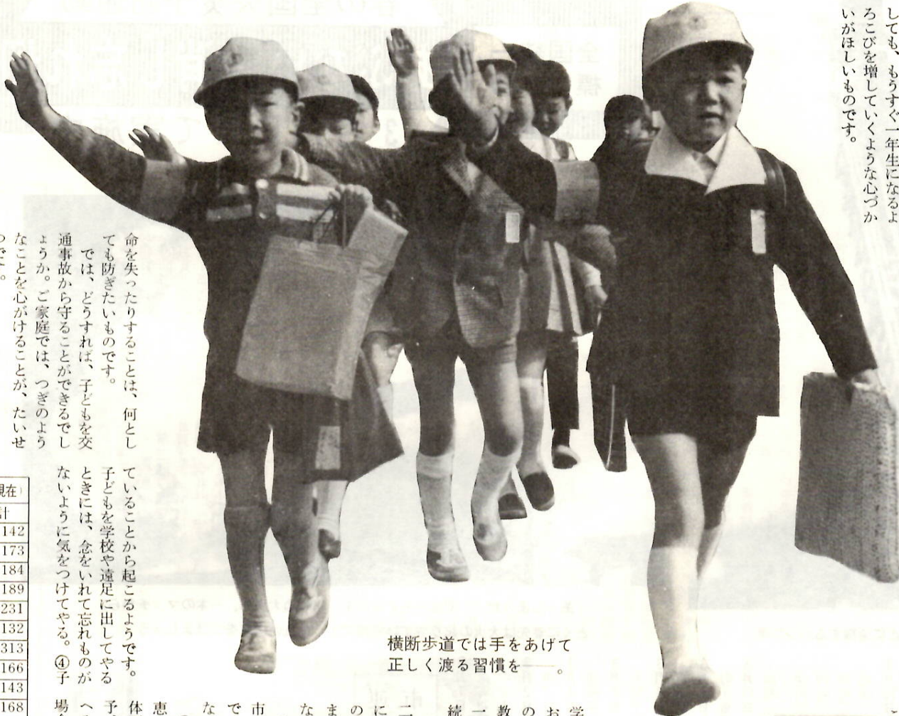
横断歩道では手をあげて 正しく渡る習慣を――

○：それに、子どもたちも、これ までとは全く変わった環境におか れるわけですから、その生 活に早くになれるように指導し、は げまして、どんなしつけをするに