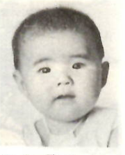
赤ちゃんは生後五、六カ月になると、母乳だけで満足しなくなり、また栄養も不足がちになります。このころから発育に応じて離乳食をはじめ、食の知識や実習について、次のとおりに講習会を開きます。お出かけください。