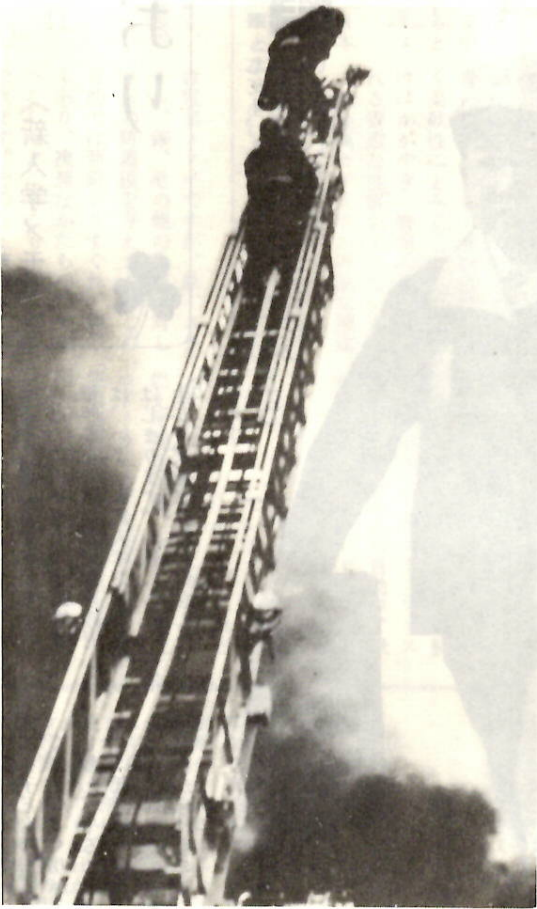
ビル火災などに活躍するハシゴ車