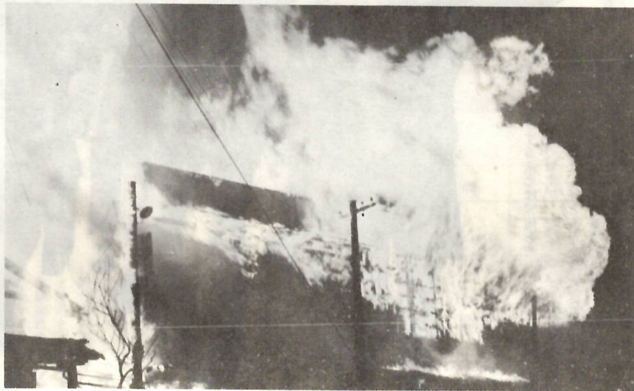
「あっしまった！」ではおそすぎます。思わぬ大火も、一本のマッチから。とくに春先は大火の起りやすい時期です。お互いに気をつけましょう。

二月二十八日から三月十三日まで「春の全国火災予防運動」を実施中です。例年二月から三月にかけては、空気が乾燥し、風が強くと大火になりやすく、そのうえ暖房器具など、火気の使用も多く、火災の起りやすい季節です。とくに、十一月から四月までの間は、年間の火災の六〇パーセント以上が発生しています。家庭や職場のみならず、防火に心がけてください。