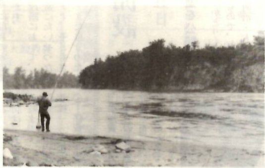
一緒に、しばらく釣れるようすもない。石ころのころした川原を歩いて、土手をのぼる。どのあたりが「掴み取りの土手」なのか、と思いつながら。

「釣りと一緒、しばらく釣れるようすもない。石ころのころした川原を歩いて、土手をのぼる。どのあたりが「掴み取りの土手」なのか、と思いつながら。 帰り道、六供町のおとしより数人に、この話をきく。 「へえ、そんな話があったのですか?」という人はばかり。もうこんな話を知る人も少ないようだ。今では、土手の跡を知るすべもない。(写真は六供地内を流れる利根川。どの辺りに掴み取りの土手があったのか、さだかでない)