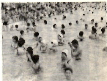
市民プールのにぎわい(昨年)