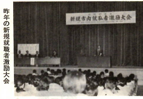
昨年の新規就職者激励大会

6月17日群馬会館で 市・商工会議所・職業安定所等の共催で、六月十七日午前十時半から群馬会館ホールで「新規就職者激励大会」がひらかれます。