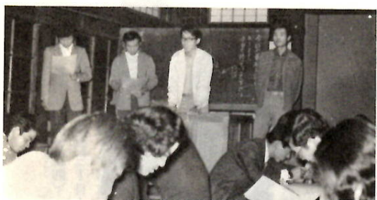
真剣な学習——前年の青年大学で。

「若く美しいからだづくり」「食卓を明るく」の二つをテーマに、中央公民館で成人学校第一期生を