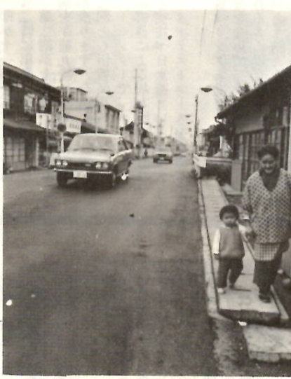
朔太郎がうたった岩神町の町並み

この詩は、高校の教科書にのっているほど有名な作品である。そのためか「小出新道(こいでしんどう)」はどこにあるのですか?