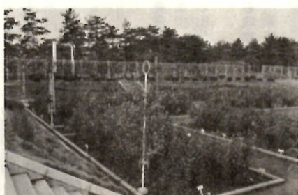
みなさんのおいでを待つバラ園

みなさんに親しまれている敷島公園の「バラ園」に、間もなく秋のバラが咲き出します。 秋のバラは、十月下旬から咲き出し、花の期間もながく、十一月中旬まで順々に咲きます。