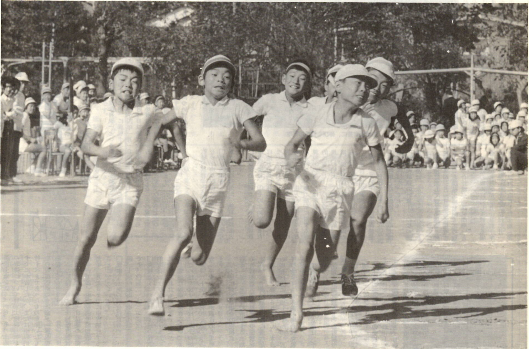
とじて保存しておいてください いつかまた お役にたつことと思います

秋空のもと、各地区で運動会やスポーツ大会が、いままたけなわ。——みんなの声を背に、力いっぱい走る。さあゴールも、もうすぐだぞ、がんばれ！ 校庭で、みんなが食べるおいしいママのおべんとうが待っている。