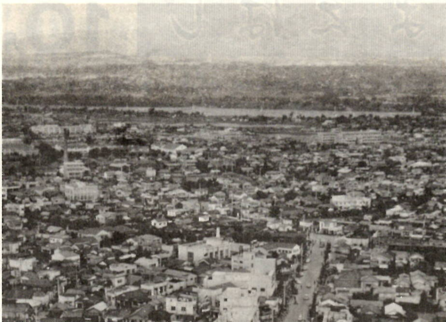
赤城を背景に、伸びる前橋市街地。

さきの地方税法の改正で、市町村税として「特別土地保有税」という新しい税が設けられました。この税は「現に所有している土地」と「今後取得する土地」に課税するという、ふたつの課税方式がとられています。「現に所有している土地」とは、昭和四十四年一月一日以後に取得し、所有している土地であり、「今後取得する土地」とは、ことし七月一日以後に取得する土地のことで、これらの土地が課税の対象となります。この税は、納税義務者が市町村長に申告して納付することによって、地方税法の規定によって「ことし七月一日から十二月三十一日までの間の土地の取得については、来年の二月末日までに申告納付していただく」ことになっています。ただし、非課税土地をのぞくこれらの土地の面積が、本市の場合五千平方メートル(約千五百二十坪)未満の場合は、免税となっています。以下、この税のあらましについてお知らせしましょう。