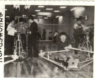
あなたの体力づくりに

●未納保険料は今のうちに 国民年金の保険料は、未納のまま二年間を経過したものは、その後、納めたくても納められない建前になっています。しかし、今回の改正で、昭和四十九年一月から昭和五十年十二月までの二年間に限って、今までの未納保険料を月額九百円の割で納めることができるようになります。