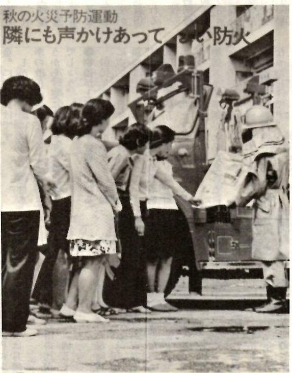
秋の火災予防運動 隣にも声かけあって防火