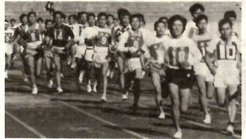
昨年の市民マラソン大会