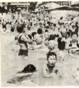
市民プールの子供たち【昨年】

オープン近づく 市民プールでは、六月十五日(土)から九月八日(日)まで、一般開場します。なお、温水プール・トレーニングセンターもご利用ください。 【開場期間】 六月十五日から七月五日・八月二十六日から九月八日までの午前九時から午後六時まで。七月六日から八月二十五日までの午前九時から午後九時まで。