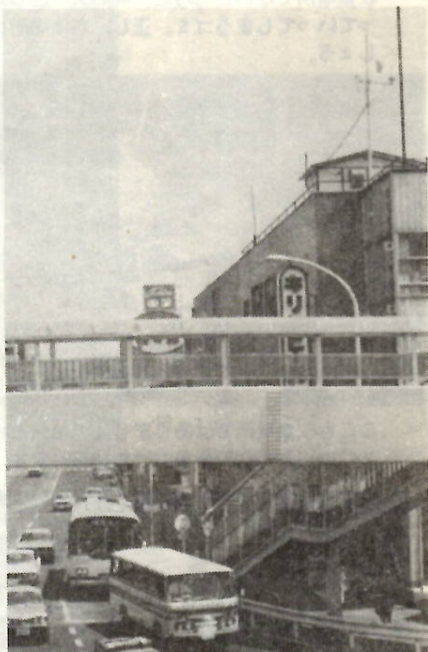
商工会議所の屋上に設置された観測所

なお、光化学スモッグについての不明な点のお問い合わせご連絡は市役所公害交通課(電話24局一三二一内線二七六)へねがいます。