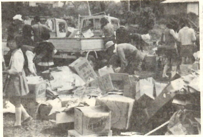
廃品回収に活躍する子供たち【江木町で】

私たちは、毎日の暮らしの中で一日も紙と無関係ではいられません。この紙をつくるためには、木材からつくったパルプと大量の水、電気が使われます。貴重な資源からつくられる紙をそのままに扱おうとはできません。