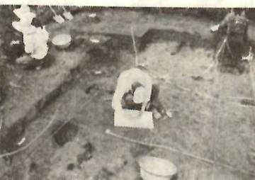
桂正田遺跡の発掘作業

すでに、縄文時代の住居跡二十七、平安時代のもの四十九、古墳一基の調査が完了。このほか住居跡と確認されているものが約二十か所あり、発掘の進行にしたがって、この数の増加は確実でしょう。