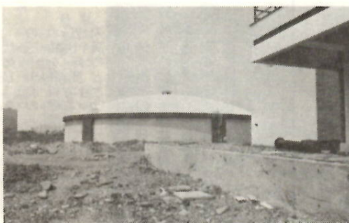
建設中の下細井水源地

前橋市の水道は、昭和四年敷島浄水場がつけられ、給水をはじめから今年でちょうど四十五周年になります。当初の水道利用者は一万六千人でしたが、現在では二十四万人の人たちが利用しており、また一人当たりの水の使用量も年々増加しています。このため、水源施設も敷島浄水場だけでは間に合