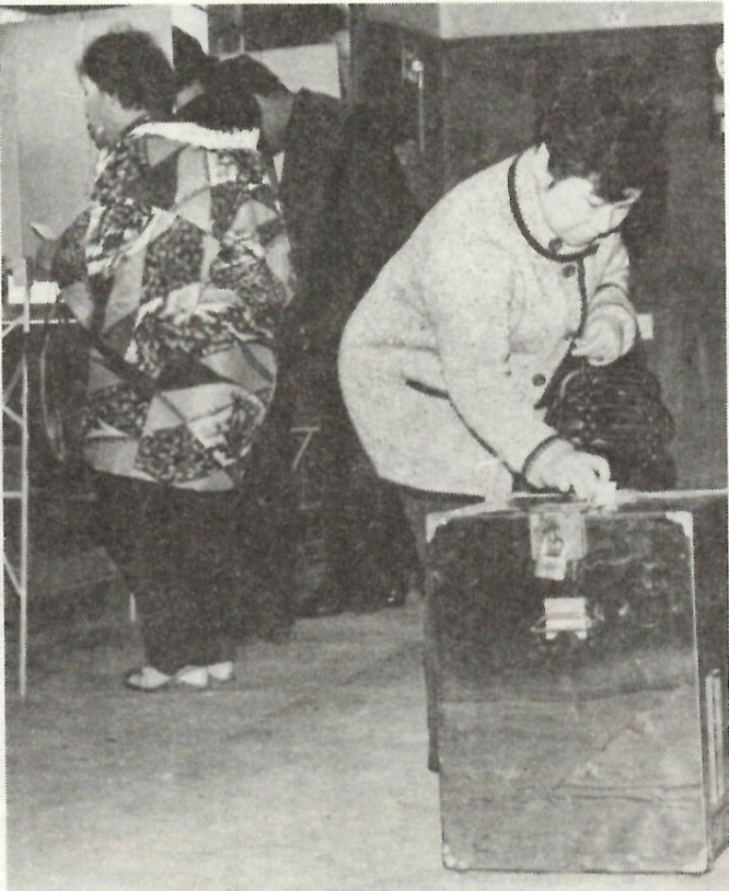
あなたの票は大切な一票です。ムダにしないようにしましょう

ていなければ投票することはできません。住所を移動され、その市町村の選挙人名簿に登録されていない方でも、前の住所に引き続きあれば、その登録地で投票できます。 【不在者投票】投票日にどうしても不在になり、投票所に行けない人は前もって不在者投票をすることが出来ます。 手続きは、住所地の市町村選挙管理委員会へ印かんを持って行き、宣誓書(用紙は市に用意してあります)を提出すれば、その場で投票ができます。