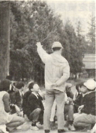
講師の説明を聴く子どもたち【二之宮赤城神社で】

市水道局では、六月一日から七日までの間、午前十時から午後四時まで、敷島浄水場、野中浄水場をはじめ、各水源地を一般に公開します。これは、地下からくみあげられた水が、浄水場や水源地でどのようにしてきれいな水になり、みなさんのご家庭に送られるかなどを、直接ご覧いただくためのものです。すがすがしい初夏の浄水場・水源地へぜひご家族づれでお出かけください。 なお、この週間を機会に水道について、お困りのことや要望などがありましたら、お気軽に水道局(電話24局一六二一)へご連絡ください。