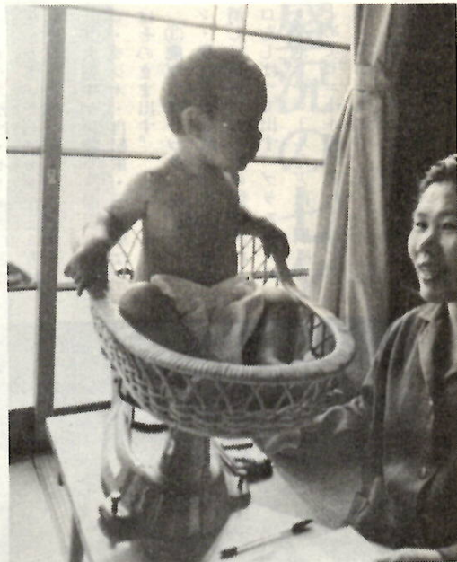
赤ちゃん元気でネ (乳児検診会場で)

昭和四十八年六月一日から四十 九年五月三十一日生まれまでの乳 児を対象に、乳児検診を行ないま す。 対象の赤ちゃんをおもちのお母 さんは、母子手帳をもって、忘れ ずに検診を受けてください。検診 内容は、問診、身体計測、診察、 保健指導など。