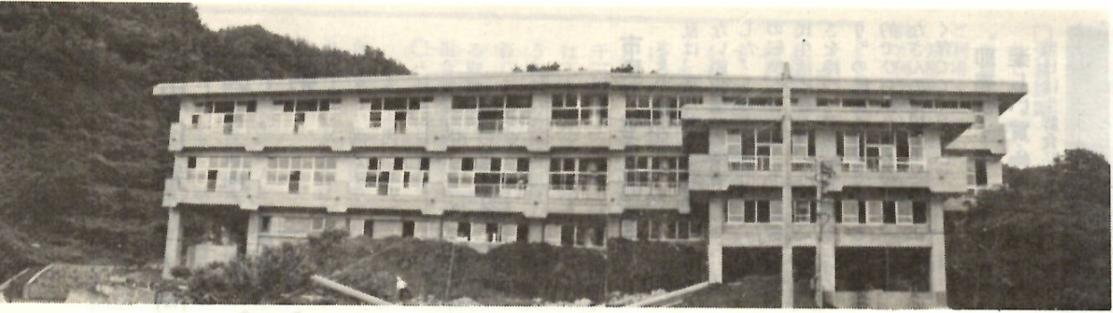
眼の下に海を望む山の斜面にできた臨海学校(上)と白い砂浜の続く野積海岸(下)