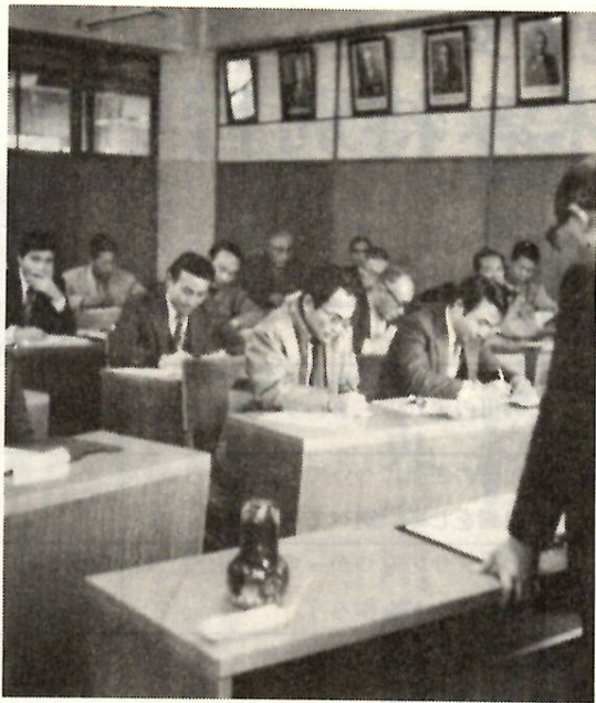
真剣に学ぶ商店主のみなさん

【労務診断】 市では、市内の企業を対象に「労務診断」を行ないます。これは、労務診断とは、企業の中で従業員が何を考え、どんな不満を持っているかを知り、問題点を発見し改善方法を文書で会社に提示、これに基づいて会社が改善し、従業員の働く意欲を高め、企業の発展に結びつけるものです。労務診断の方法は、意向調査（従業員から質問票により意向を聞く）聞き取り調査（経営者から調査票により聞く）、見取り調査（診断員が直接調査）を行ない、組織命令系統、人事、教育訓練、賃金、労働時間、安全衛生、作業環境、福祉、生産性について総合的に診断し、改善方法を文書で提示します。なお、診断には、市工業課の職員が、あなたの会社へ直接伺います。内容についての秘密は厳守します。