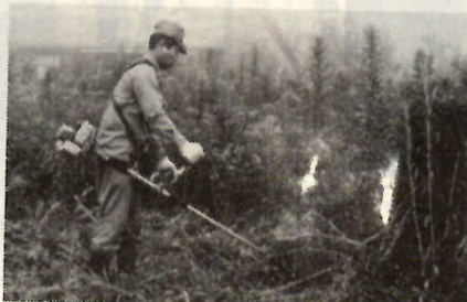
手軽に使える小型草刈機