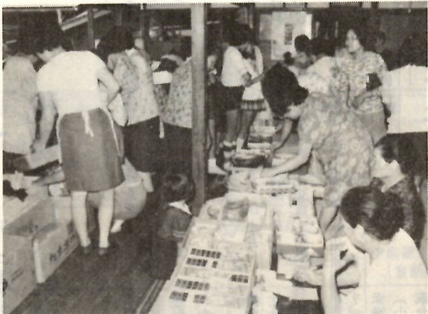
開場30分で売り切れた不用品交換会

す。ただし、時々殺虫剤をまくようにしないとハエの心配があります。こうするとゴミの回収の手間を