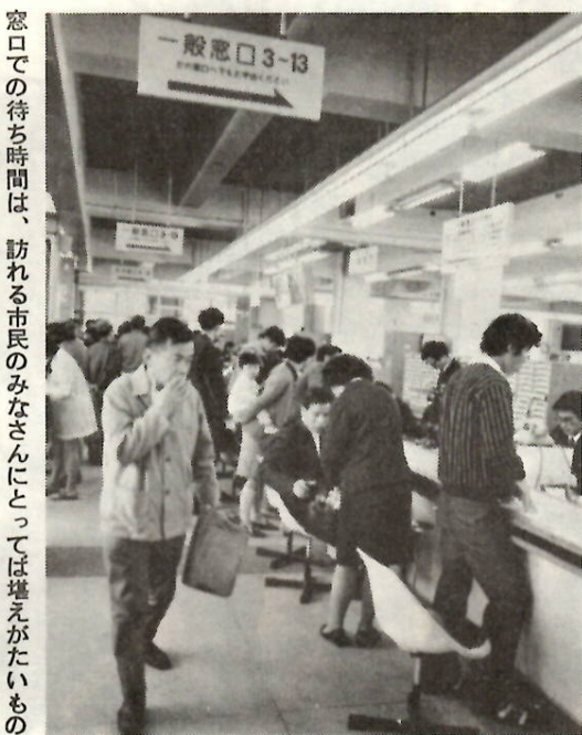
窓口での待ち時間は、訪れる市民のみなさんにとっては堪えがたいものでしょう。係員としても、本人を確認するという必要上から、いろいろ訪ねるわけで、止むを得ないことだったわけですね。

印鑑の正確な届け出を図り、印鑑証明書の交付を簡単に、市民のみなさんの取引の安全と一層の利便をはかるという目的で新しい印鑑制度が四月一日からスタートします。この制度では、印鑑の届け出をしたかたは、印鑑登録証（印鑑手帳）が交付され、印鑑証明をもらうときには、この手帳を持ってれば、登録印を持参しなくても、印鑑証明書の交付が受けられることとなります。手続を簡単にするだけなら、待ち時間を少なくし、市民のみなさんの利便をはかることとなります。そこで、今回から四回に分けて、この「新しい印鑑制度」についてお知らせしてみようと思います。