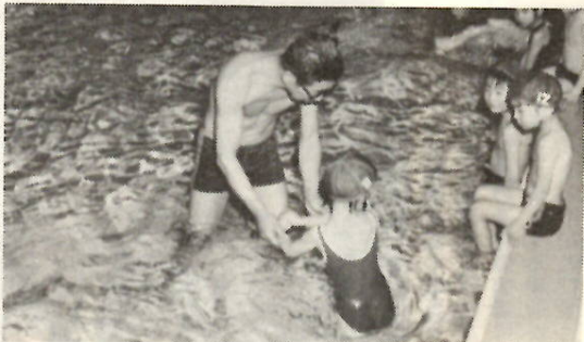
毎回盛況の講習会（前回）

中級者の受講資格は、幼稚園年 長組から小学校六年生までで、一 種目二十五メートルから五十メー トルまで泳げる人、または泳げる 種目とは別の種目（泳法）を習い たい人が受けられます。