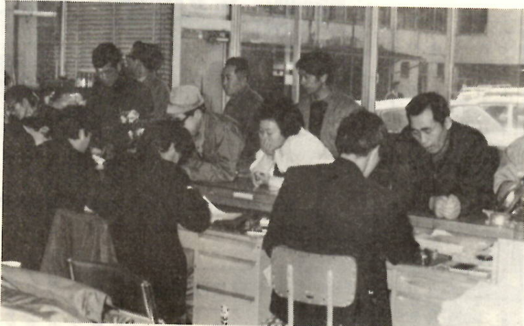
市民税の申告でにぎわう市民税課の窓口 (昨年)

昭和五十年年度の市民税は、四十九年中に所得があり、五十年一月一日現在本市に住所のある人に課税されます。 申告期限は三月十五日までです。申告期限は次のことをよくお読みの上、必ず期限内に申告してください。