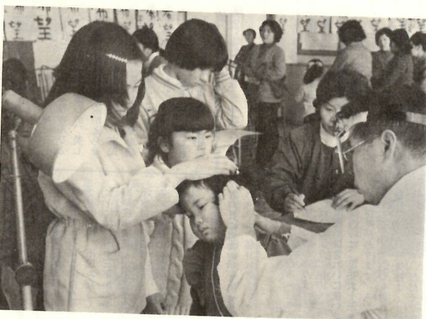
からだで悪いところはないかな？ 新入学時健康診断で——（駒形小）

園をしていたお子さんも、上級生や友だちと集団登下校をするようになります。また、時にはひとりで下校することもあります。統計的には、四月が交通事故の多い月とされていることから、家庭で