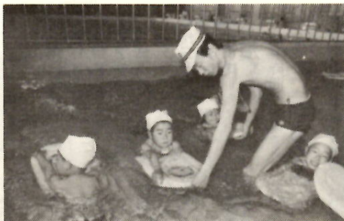
グループ別に指導を受ける (初心者水泳講習会)