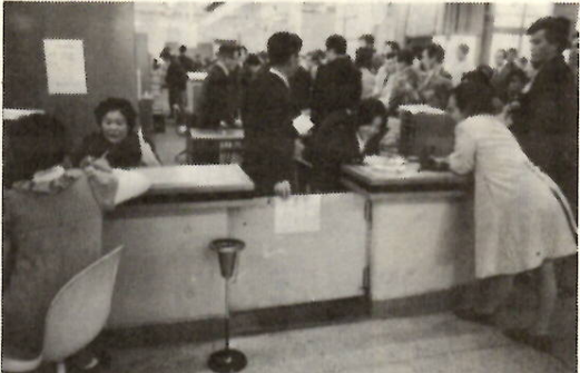
年金手続も忘れずに——市民課窓口で

年金手続も忘れずに——市民課窓口で。国民年金に加入している人が、住所変更などをした場合は、忘れずに次のような手続きをしてください。住所を変更した人——新しく他の市区町村から転入してきた人や市内で住所を変更した人が、市役所市民課窓口で住民異動届をするときは、必ず国民年金手帳を持参して国民年金手帳の住所変更も同時にしましょう。