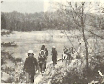
すがすがしい春の尾瀬

前橋山岳会主催、市教育委員会、市体育協会後援で、五月二十五日(日)六月一日(日)の二回にわたり、尾瀬沼周辺(歩行距離約十七キロ、約六時間)を訪ねる市民登山の会を開きます。