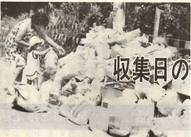
ボクもママのお手伝い(広瀬団地内)

を出すときは次のルールは必ず守ってください。＊まずゴミの分類を完全に燃えるゴミ(厨芥類、紙類、布類、木くずなど)。