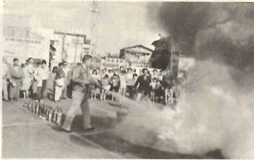
朝市の消火実験コーナー

商店街(本町一・二丁目八幡様西 通り)で、二十七日(日)午前七 時から九時まで開かれます。 当日は日曜大工コーナー、消火 実験・消火器の即売・プロパンガ ス相談コーナー、水道相談コーナ ー、趣味の散歩コーナーなどを設 け、楽しい朝市にしようと計画し ています。