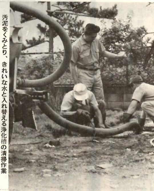
汚泥をくみとり、きれいな水と入れ替える浄化槽の清掃作業

①し尿浄化槽を使用する場合は維持管理を完全に行うことが大切です。使用方法が不適正であると非衛生的であり、近所のみならず迷惑をかけることになり、必ず浄化槽の清掃をしたいものです。②原則として一年に一回は、必ず浄化槽の清掃を、市の許可を受けた専門業者が行う必要があります。指定業者は次のとおりです。