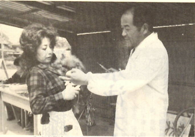
狂犬病予防注射を受けさせるのも愛犬家の義務 (下川淵公民館で)