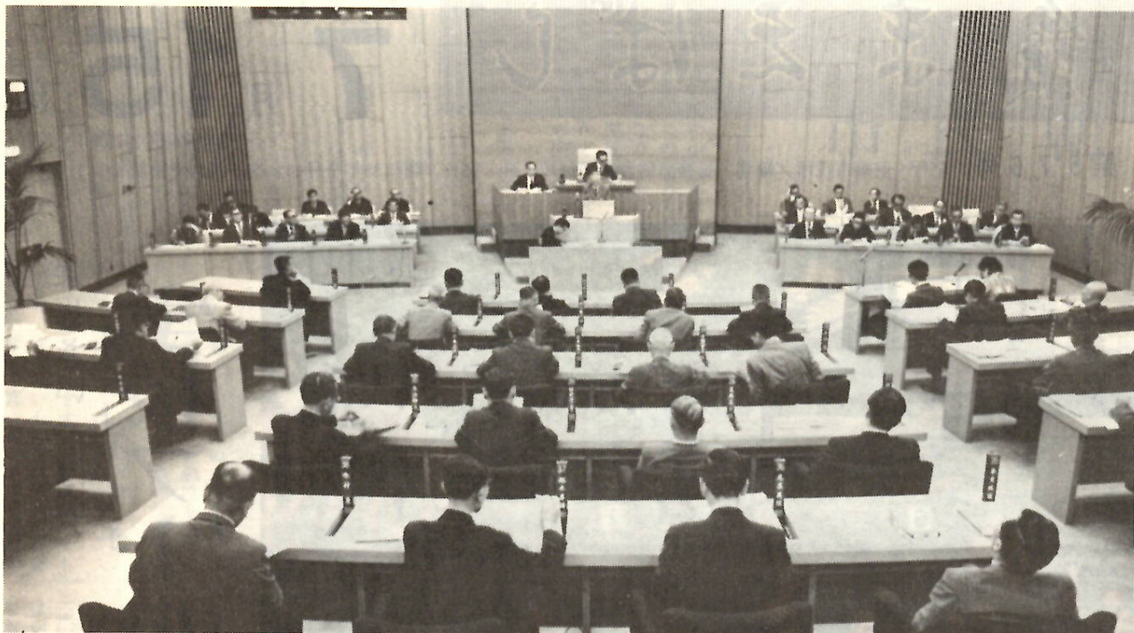
6月定例市議会会議場（最終日の3日写す）

昭和五十年第二回定例市議会は六月二十七日から七月三日まで会期七日間で開かれ、議案十七件、報告四件が上程され、審議の結果それぞれ可決・承認されました。この議会で最も重要な案件として提案され、論議の中心となったのは「国保税率の改正」でした。なお、可決議案等の詳細は条例施行のつど広報紙に掲載しますのでご覧ください。