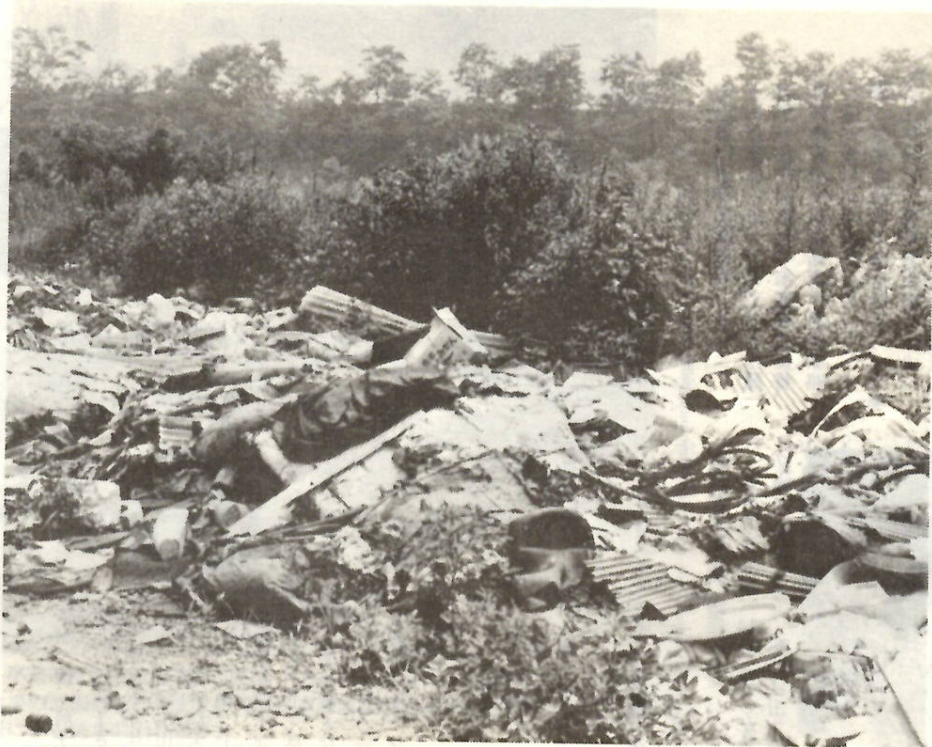
不法に捨てられたコンクリートの破片、紙・木くずなどの事業廃棄物——川原町の利根川原で

市ではみなさんの日常生活から出る一般廃棄物、つまり普通のゴミの処理を行っています。事業所等から出る事業廃棄物は、この一般ゴミとは別の処理方法をとっています。ところが各町内の一般家庭のゴミの収集場所に、事業所の廃棄物を出す人があつてしまっています。