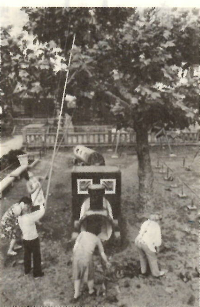
ママさんも協力—アメヒト防除。

緑の害虫アメリカシロヒトリは五月下旬から第一世代が発生しましたが、市民のみなさんの「自主防除」の徹底により、相当の防除効果あげることができました。しかし、まだ目につかない樹木