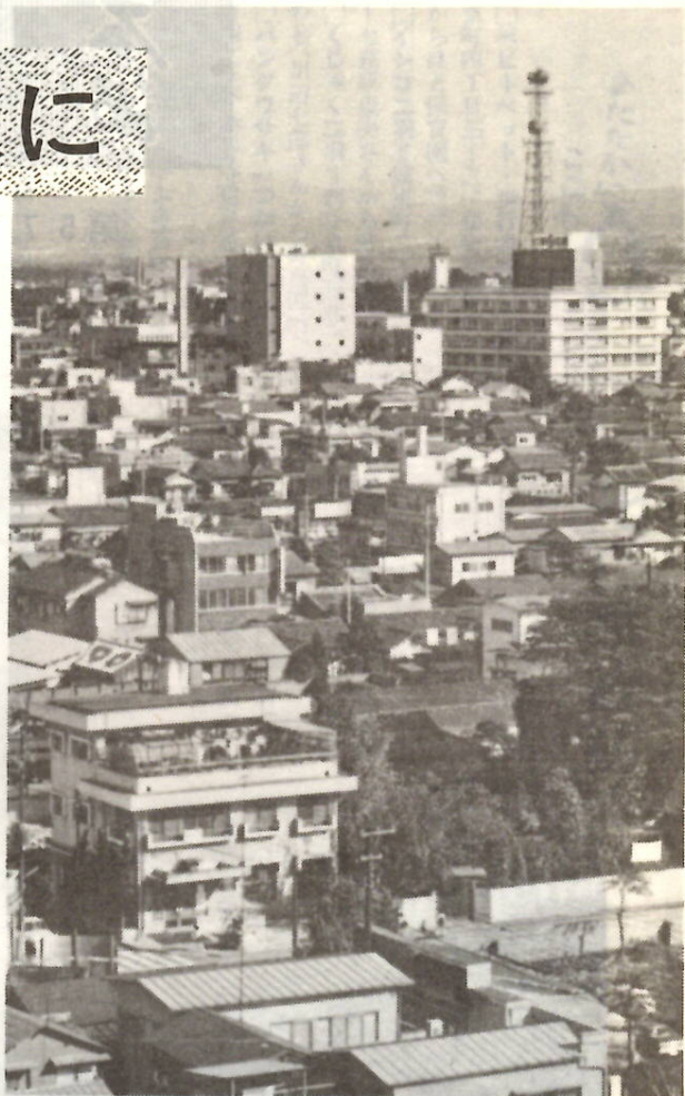
発展いちじるしい前橋市街地。