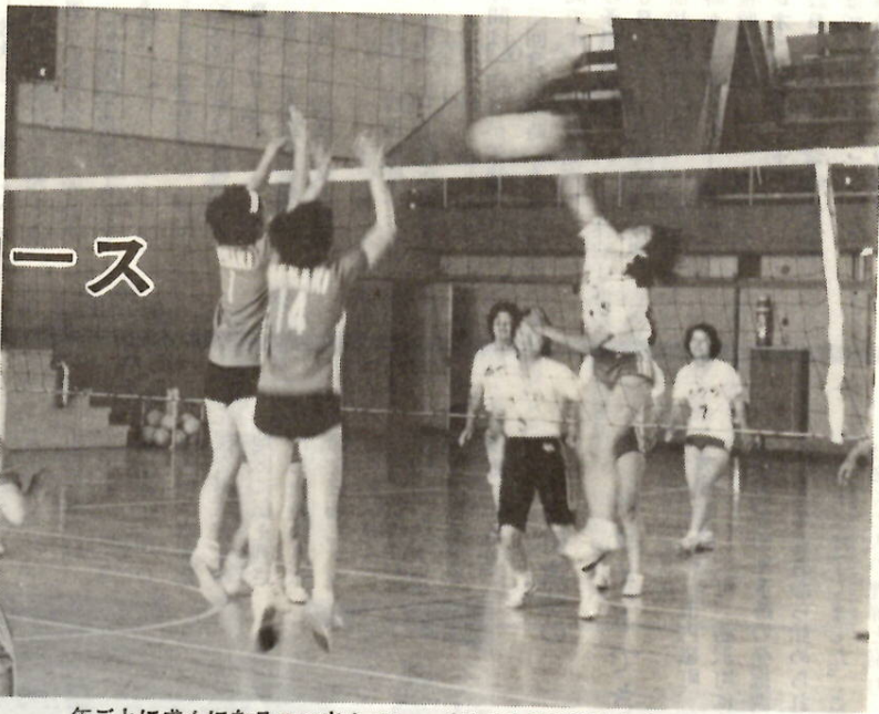
年ごとに盛んになるママさんバレー（7月1日に行われた県大会で）

市教委、市バレーボール協会主催で、八月十七日・三十一日（日）の二日間、県営バレーボールコートで、市内に在住する家庭婦人を対象に、バレーボール教室を開きます。