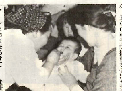
アーンとお口をあけて——桂重公民館で

ポリオ（急性灰白髄炎）予防接種は、約六か月の間隔で二回接種することになっています。該当する子どもさんは必ず受けてください。 なお、この予防接種は市以外では行っておりません。