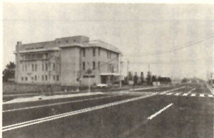
大友町の勤労青少年ホーム

勤労青少年ホームは、中央大橋から産業道路へ抜ける県道前橋・安中線のわきにあります。上越線立体交差の開通で、今までのように回りの道が必要なくなり、市街地からクルマで五分で行けるようになりました。ホームでは、書道、