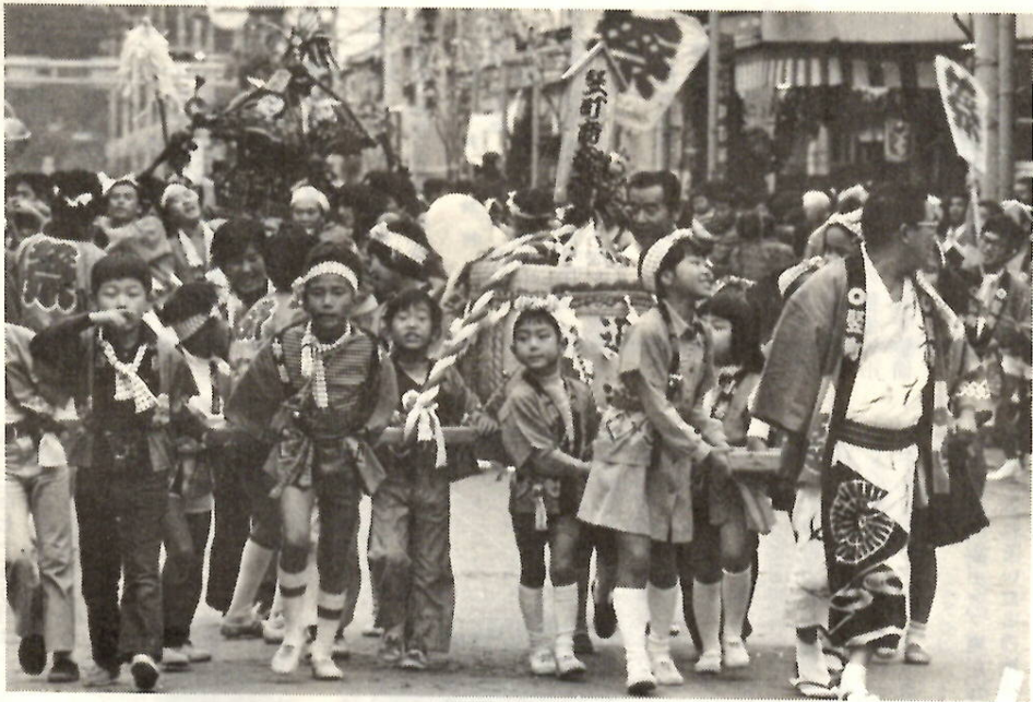
ミコシについて、ボクらも参加——昨年の前橋まつりから

10月11日(土)12日(日)は前橋まつり。みなさんの参加で一年に一度のまつりを、盛り上げましょう。まつりの主な行事を紹介してみます。 ◇前夜祭「まつりふれ太鼓」が前日、市内を巡行し、まつり気分を盛り上げます。 ◇郷土民謡流し11日・12日の両日、午後2時40分から、婦人会、各種団体のみなさん約三千人が参加し、中央商店街で「郷土民謡おどり」をくりひろげます。 ◇鼓笛吹奏楽パレード11日(午後2時から)12日(午前10時30