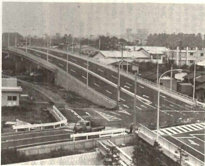
10月1日、自動車道開通となる前橋・安中線の立体交差

伸びた道路……。この上越線立体交差道路が、きょう十月一日午後一時から自動車道だけが開通になります。