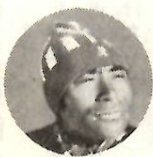
三浦雄一郎氏 九月二十六日に開催予定であったスキーの三浦雄一郎氏の講演は、講師の都合（カナダ首相、トリニダード氏の招きで、親善使節として渡加のため）で、十月十四日（火）に変更となります。

みなさんには、たいへん迷惑をおかけいたしますが、国家的行事のために変更を余儀なくされましたのでご了承の上、当日は多数ご聴講をおねがいいたします。