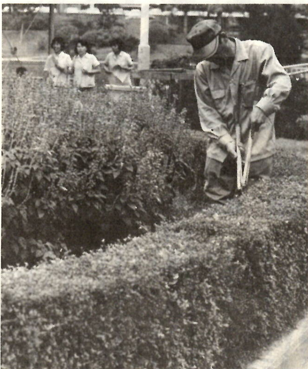
花壇の手入れもねんごろに（前橋公園で）