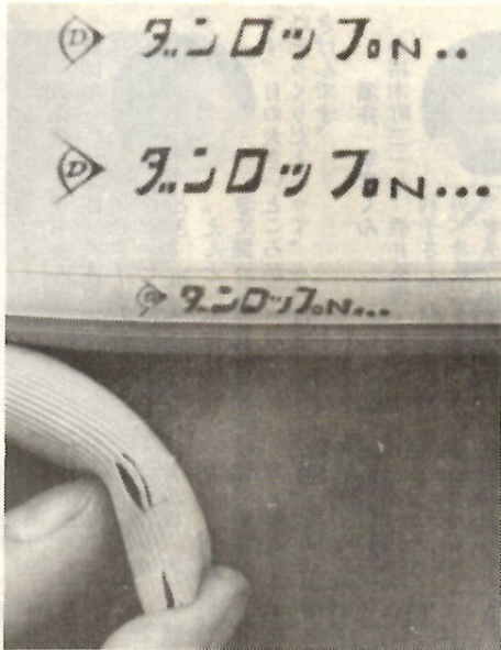
新しいのにタテにひびが入りやすい ダンロップN欠陥ホース

プロパンガスがもれると、大爆発など危険がいっぱい。このたびは、この爆発につながる「欠陥ホース」が発見されました。