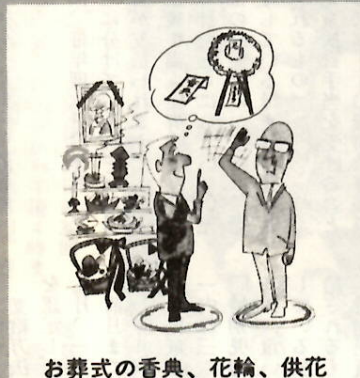
お葬式の香典、花輪、供花