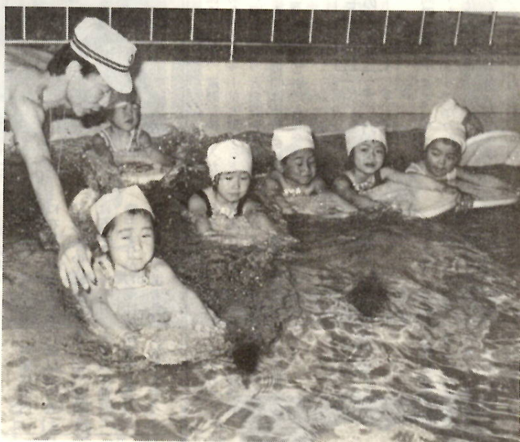
ビート板を使って水泳の基礎練習（前回の初心者水泳講習会）

から20日までの間（火曜日は除く）に受講手続きを済ませてください。手続きの際、身長、胸囲、体重、泳力を書き込んでいただきます。付添い希望のかたは受講生と同額の経費が必要です。