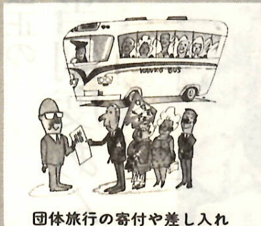
団体旅行の寄付や差し入れ