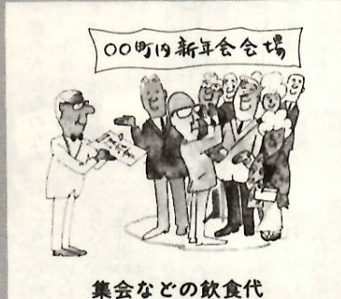
集会などの飲食代