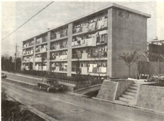
太陽と緑の住宅地——芳賀の市営住宅。

五十年度の市営住宅は、現在、芳賀と国領に建設中です。この入居者を募集します。この募集は、芳賀・国領のものではなく、一括公募です。あなたは芳賀へ、あなたは国領へという入居住宅の決定は、第二次選考に当せんした人の中で、あらためて抽せん会を開いて決められます。なお、この募集は、今までの市営住宅の中で、退居のため空き部屋となつているところへの入居募集にもなっています。年一回の応募の機会です。市営住宅に入居希望の人は、お見のがしなく。