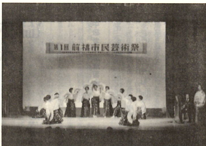
ライトをあびて、あでやかな詩舞に観客の目はひきつけられる。