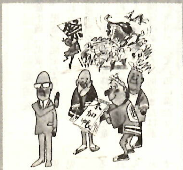
お祭りなどの寄付、お酒など