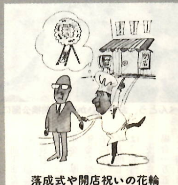
落成式や開店祝いの花輪