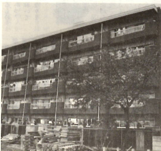
既設の国領市営住宅

居住している連帯保証人二名(五十年市民税を納期分まで完納、申込者と同等以上の収入のある人)の保証を得られる人。