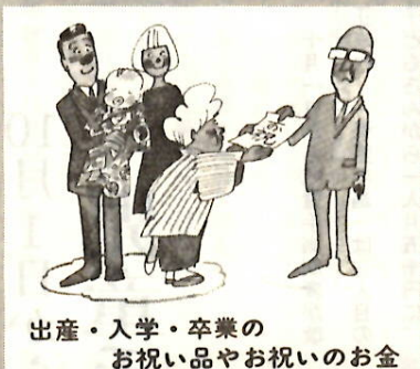
出産・入学・卒業の お祝い品やお祝いのお金