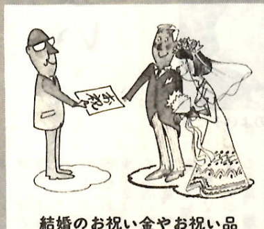
結婚のお祝い金やお祝い品