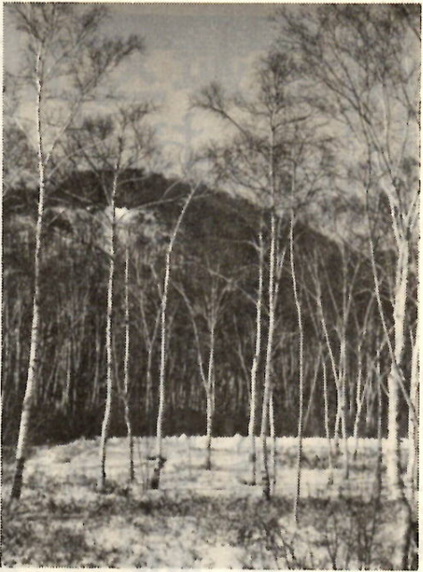
黒檜に樹氷が見られる赤城。間もなく純白の雪の季節がやってくる。

ここ数日、海拔千八百二十八メートルの黒松山頂には、美しい樹氷が見られます。日ごろ、冬山の自然に接する機会の少ない私たち