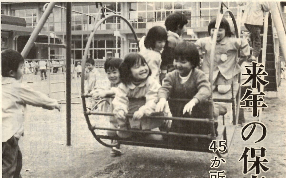
みんな仲よく遊びの時間です(第4保育所で)