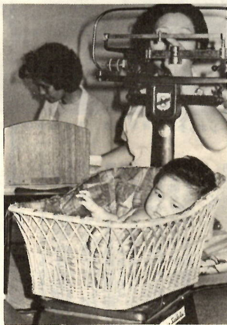
母子健康相談 (メデイカルセンターで)

午まで、前橋保健所精神衛生係(電話31局七二二)が担当します。不眠・いらぬなどでお困りのかたはどうぞ。