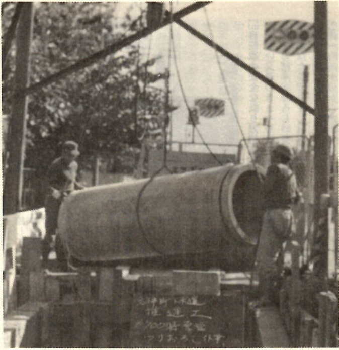
下水道推進管の埋設作業（岩神町）

将来の公共用水域、つまり利根川やその流域の河川などの水質保全を中心とした、県の「流域下水道計画」を基にした長期計画も、この中に