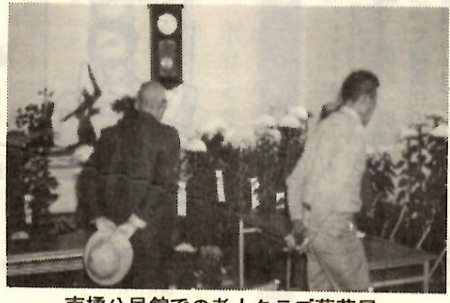
南橋公民館での老人クラブ菊花展

もまで三千人が参加の盛況。秋の一日をさわやかに競技に汗を流していた。なかでも年齢制限のない三千メートルマラソンは人気のまゝと、多数の参加者が大声援のなか、グラウンドをめぐる。この運動会の特別出演は上川淵小の鼓笛隊、上川淵・下川淵青年団の八木節、そして交通安全母の会の会員による「交通安全音頭」の踊りの三つ。最近、交通事故が増え続けている折、交通安全への母の願いがこめられたこの踊りは、なかなかの好評だった。