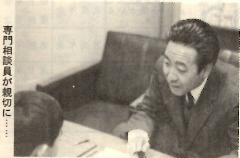
専門相談員が親切に……

日ごろ、困っていること、悩んでいることを、いっしょに考えましょう。悩みを、あなただけの胸にしまっておかないで、係員とともに