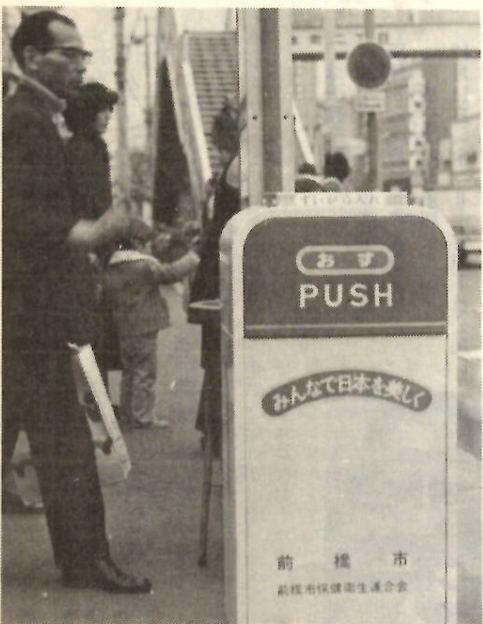
本町バス停に設置されたグリーンボックス

私たち日本人は、もともときれい好きで、自分のまわりは神経質といわれるほど、きれいにする人種です。 しかし、いったん外に出ると、吸がらや紙くずを平気で捨ててかえりみないところがあるのは、何としても困りものです。 ここ数年、ゴミに対する公徳心は高まりつつありますが、まだまだ公園やバス停など、人の出まわるところでは、ゴミの放置が目立ちます。