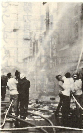
こうなってからでは遅い。火災は未然に防ぐことが先決。

年の瀬は、そのあわただしさから、とかく火の取り扱いがおろそかになりがちで、火事が集中して発生しやすい、強い風が吹くと大火事にもなりかねません。 そこで、十二月二十五日から三十日までの六日間、「歳末防火運動」を実施します。 主な内容は、①消防署員による夜間パトロール②バー、キャバレー、飲食店などの防火査察③消防