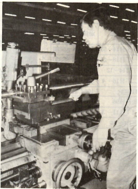
償却資産第二種の機械装置（市内の工場）

事業用償却資産を所有する場合は、地方税法の規定で毎年一月一日現在の償却資産を一月三十一日まで市へ申告することに決められています。 申告書提出の法定期限は一月三十一日までとなっていますが、限られた期間内に市ではこの償却資産の評価を完了しなければなりませんので、一月二十日までに市役