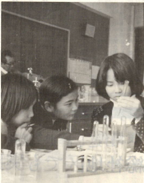
「これ、多すぎるんじゃない？」真剣なまなざしで理科実験が続く（広瀬小学校）

＊一年間の自分の学業生活や日常生活、行動について深く内省させ、新しい年の努力目標をたてさせたいもの。同時に、三学期の具