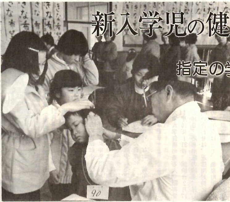
「お耳、だいじょうぶかな?」駒形小学校で。

明年四月に、あたらしく小学校へはいる子どもの、就学前健康診断を行います。 対象者は昭和44年4月2日から45年4月1日までに生まれた子どもさんです。対象のお子さんは、もれなく受けてください。 この「健康診断通知書」は、実施日一週間前までに、各学校から町内の自治会を通じてお届けする予定です。万一、通知もれの人や