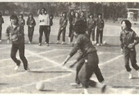
「しっかりノ」ハンドル練習に黄色い声があふく。（市立女子高）

を工夫しましょう。 参考書の使用については、自分の学力や勉強方法にあったものを選びましょう。 ＊健康の保持に気をつけよう。日ごろよくぶな人でも、無理な学習などから病気になるかきやすいといわれています。特に受験直前は病気になるからといって休養や栄養に気をつけましょう。 また、家庭において計画的に軽