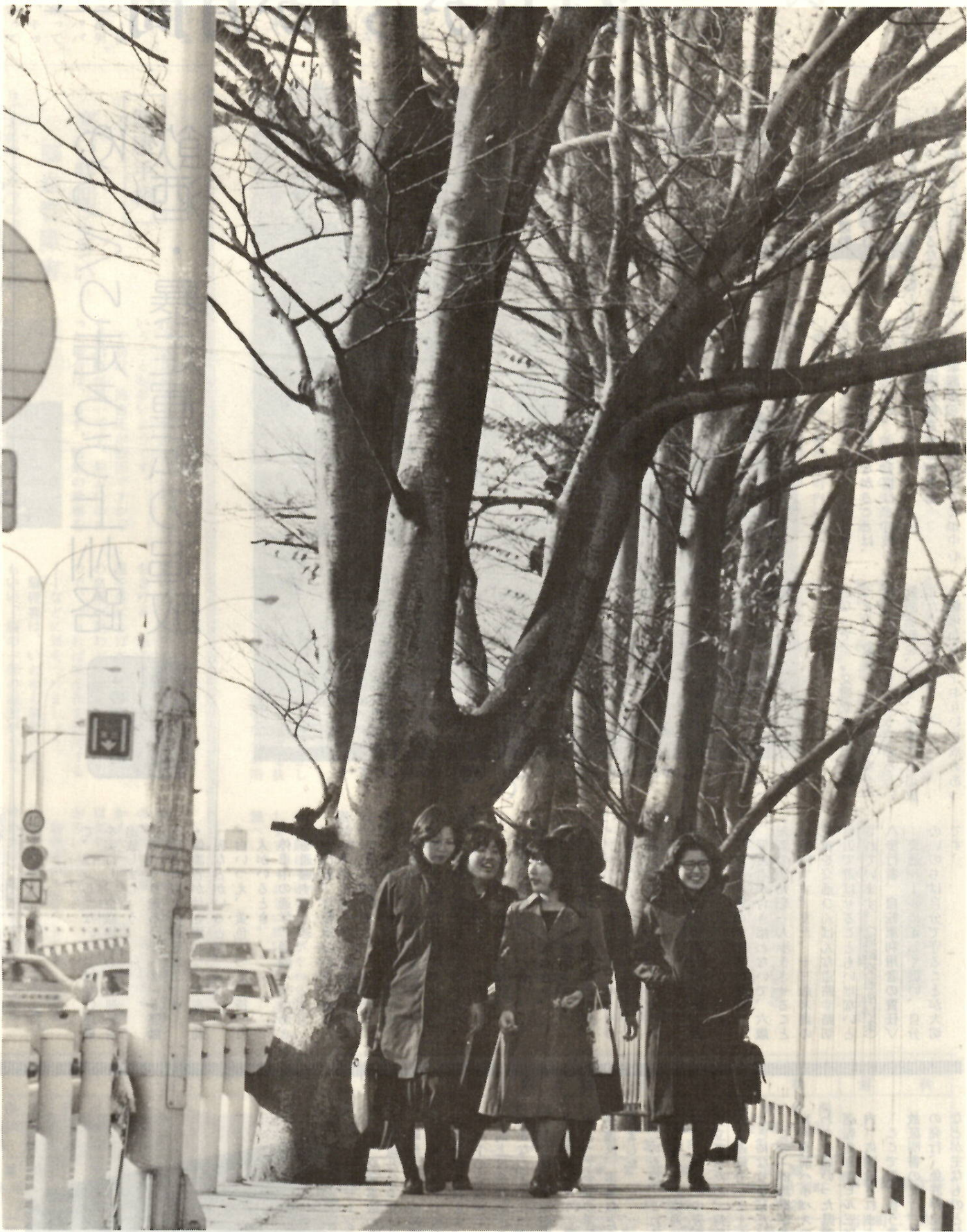
冬日のなか、ケヤキの下の歩道を歩く女子高校たち。(中央児童遊園付近歩道で)