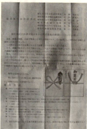
総社地区で各家庭へ配ったチラシ

冠婚葬祭簡素化運動は、ことし八月十二日の市の「提唱会議」から四月、ほぼ全地域が地区ごとで実践することを決め、大きな推進をみせています。今まで、広報紙を通じて各町内の実践状況を一回にわたって紹介してきましたが、今回は十二月一日から全町内がこぞって簡素化を推進することを決めた総社地区を取り上げてみましょう。