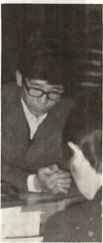
窓口センター 4日から開園します。1月9日・13日・20日・27日が休園です。老人福祉センター 12月29日から1月3日まで休館となります。4日からは通常どおり、毎週月曜日が休館。あさ10時から午後5時まで。温水プール・トレーニングセンター 12月26日から1月9日までの十五日間は、場内整備と年末・年始のため休館し、10日から平常どおりご利用いただけます。

年末年始の休館は、12月27日から1月5日まで。1月6日から16日まで、閉館時間を午後5時とします。1月17日、休館日と閉館後の図書返納は東側入口にある返納ポストをご利用ください。