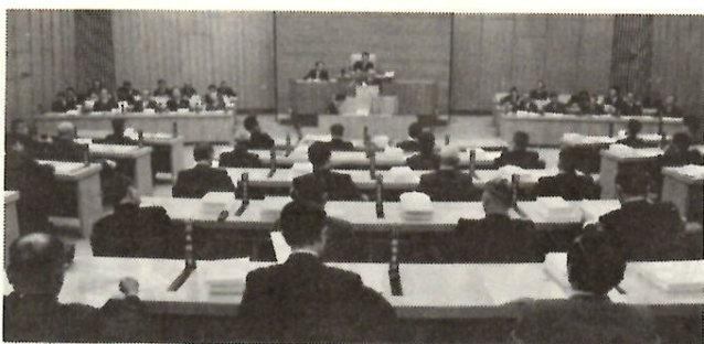
審議が続く12月市議会（1日の本会議場で）

昭和五十年第四回定例市議会は、十二月一日開会、二十二日まで、会期二十二日間の予定で現在開会中である。この議会は、別名「決算議会」と呼ばれているように、昭和四十九年度の決算の審議を重点に、各種議案が上程されていますが、詳細については、次号以下の広報紙に掲載いたします。この議会の会期予定は次のとおりです。