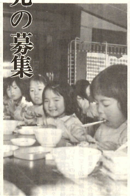
みんなと一緒に楽しい食事(第一保育所で)

20日までの四日間、各保育所(園)と市役所福祉事務所(市庁舎一階)でお渡しします。ただし、新設の保育園については、しゃか第二保育園はしゃか保育園で、上細井保育園は市福祉事務所、宝塔保育園は総社光蔵寺(総社町総社一六〇七)で、それぞれ申請用紙をお渡しします。 □申請の受け付け 1月7日から9日までの間、入所を希望する保育所(園)で、それぞれ受け付けます。ただし、新設のしゃか第二保育園はしゃか保育園で、上細井保育園は南橋公民館、宝塔保育園は光蔵寺で受け付けます。 □入所の決定 申請書を受け付けますと、ひきかえに「面接調査通知書」をお渡しします。この「通