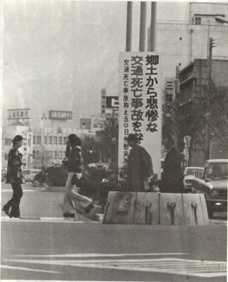
年末、歩行者事故も多いこのごろ。横断にも気をつけて一。

□飲酒運転しない運動 ①車を運転するときは、酒を飲まない。(のるなら、のむな) ②酒を飲んだら、車を運転しない。(のんだら、のるな) ③運転する人には、酒をすすめ