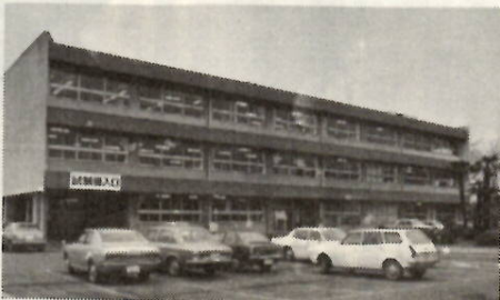
1月からこの3階に安全センターがはります。

まず、「交通事故証明書の発行」では、現在警察署長が発行していましたが、一月一日からは「自動車安全運転センター群馬県事務所」が発行することになります。証明書の必要人は、申請書(警察署・派出所・駐在所・損害保険会社・農協・各地区交通安全協会・交通安全協会事務局などの窓口)に備えてあります。に手数料を添えて最寄りの郵便局から申し込んでください。証明書は郵便で送られます。センター事務所まで直接申し込んだかたには、窓口でお渡しします。