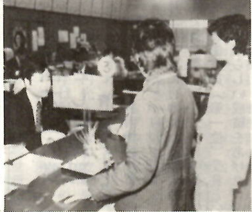
手続きは金融機関の窓口で

日ごろ忙しいかた、不在がちな家庭で利用されると、一層便利でしょう。申し込みは、預金に使用している印かん通帳を持って市内の取引金融機関へお申し出ください。詳しく知りたいかたは、市役所税課課税納付係（電話24局一一一内線二一五）か、金融機関の窓口へお問い合わせを。