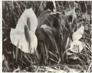
尾瀬に咲く水ばししょうの花

前橋山岳会、市教委、市体育協会による「春の市民登山の会」をひらきます。残雪と水ばししょうの尾瀬沼周辺十六キロ（約五時間三十分）を歩くもので、今回は五月三十日と六月六日の二回実施されます。参加希望のかたは、どちらか希望する日を申し込んでください。定員は、第一回・第二回とも各百二十人で、貸切バス三台に分乗していただきます。 両日とも、出発は前橋駅前をあさ五時半（厳守）帰りは同駅前による七時ごろの予定で、小雨決行です。 参加希望のかたは、会費二千三百円を添えて、五月十八日までに市内運動具店（ヤバタ、徳永、相川、スズキ、イソベ徳永）か県庁通り大井陶器店へ申し込んでください。