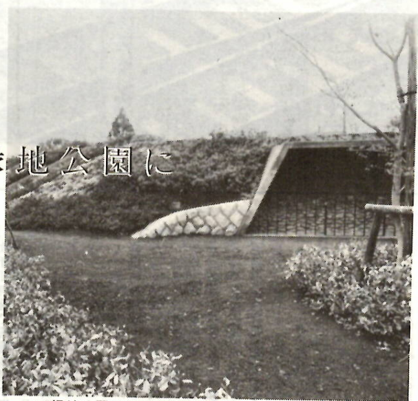
緑地公園として生まれかわりつつある王山古墳

王山古墳を児童公園として保存する工事が進んでいます。王山古墳は、全国でも珍しい積み石型の古墳で、六世紀当時の朝鮮半島との交通を物語る貴重なものといわれています。 たて六十五メートル、よこ四十二メートルの前方後円墳で、県内でも有数の大型古墳です。利根川から運び上げられたとみられる百数十万個の石が、古墳全体に整然と積み重ねられています。 この積み石をふくめて、古墳