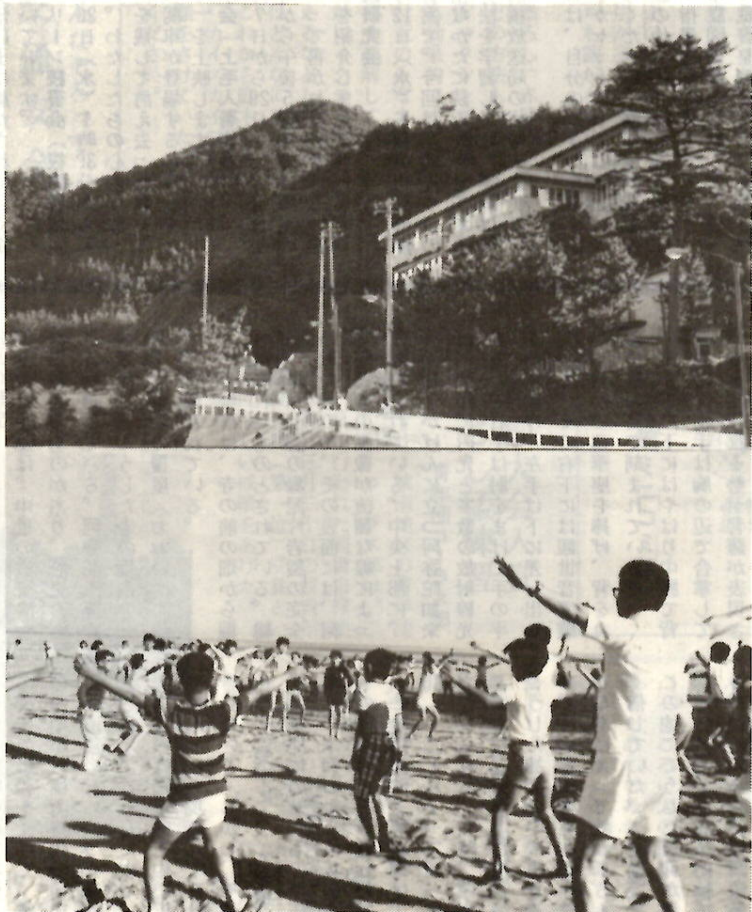
新潟県寺泊町野積海岸の小高い山の中腹にある臨海学校（上） 臨海学校前の海岸で海を眺めながら朝の体操をするよい子たち（下）

新潟県寺泊町野積海岸にある前橋広域市町村圏振興組合の「臨海学校」では、七月・八月の子どもの入校期間を除く五月・六月・九月・十月を各種団体や一般のみなさんにご利用いただいています。 みなさんの利用日数は、四泊五日以内で、一泊につき五百円（中学生以下二百円）休んだだけの人は一人五百円（中学生以下五十円）で、食事は臨海学校近くの食堂による仕出しです。 詳しくは市教委体育課（電話24局一一一内線二九四管理係）へお問い合わせください。