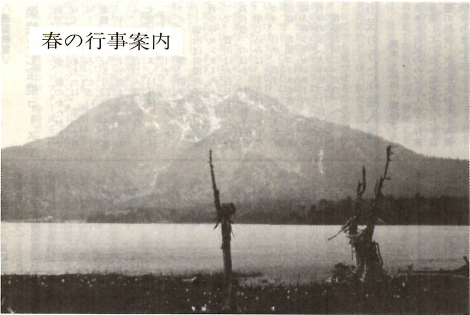
早春の尾瀬——残雪と水ばししょうの尾瀬沼にも春が……。