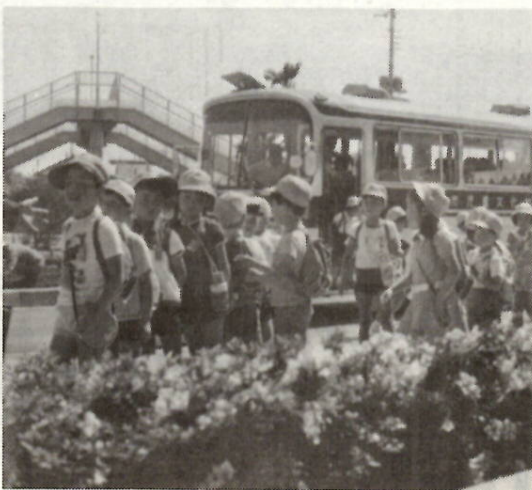
センターのバスで野鳥の観察に行く生物教室

です。当日の持ちものは、帽子、水筒、運動靴をはき、べんとう、雨具、双眼鏡、筆記用具、図かんそのほか山を歩ける身支度で。申