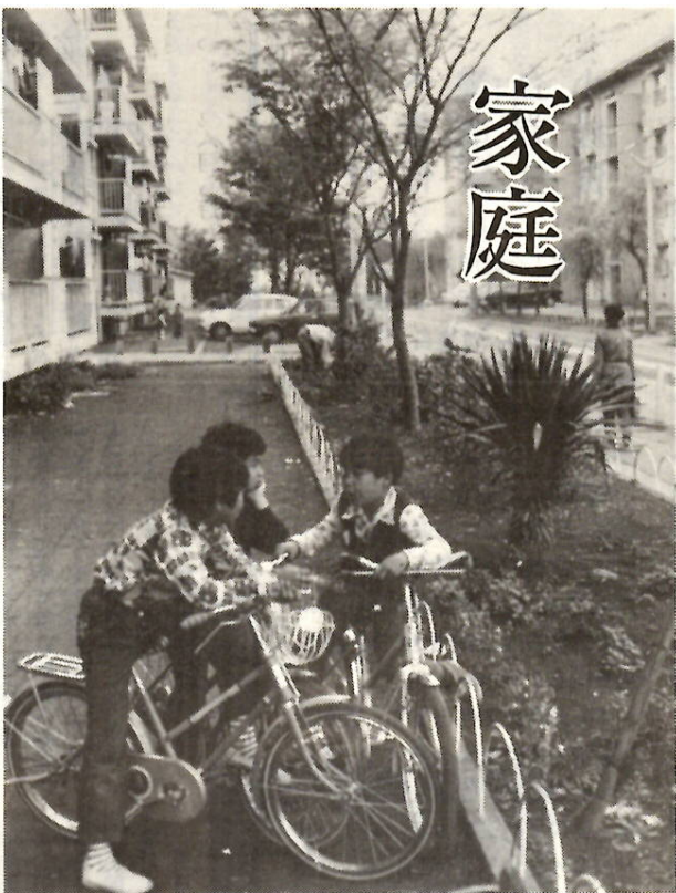
ボクたち何の相談かな？（広瀬団地で）