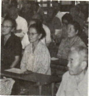
みんな熱心に——昨年の明寿大学で

高齢者の学習の場として、知識と教養を身につけ、自分のもつ趣味や興味をのびし、これからの人生を楽しむものにして——という目的の教室です。社会変化の理解、健康管理、郷土の歴史、高齢者の役割、社会奉仕活動、趣味とレクリエーション、社会施設見学などが予定されています。みなさ