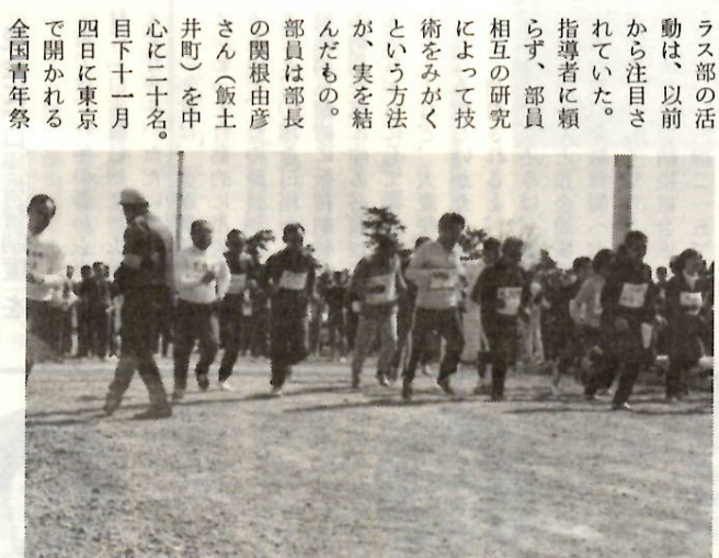
150人が参加した南橋マラソン

城南地区の青年団 コーラス部は、二 月二十日に行われた前橋市青年 祭で優秀賞、三月二十日の県青年 祭で最優秀賞（第一位）受賞とい う、すばらしい成績をあげた。