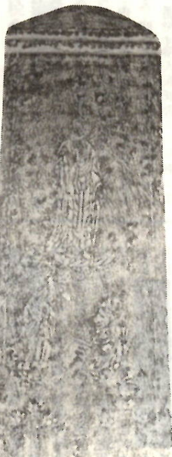
阿弥陀三尊がえがかれている板碑

伸びゆく子どもの日のついで5月5日第一会場 子ども公園第二会場 敷島河川敷公園SL写生大会、ミニ機関車試乗会、よい子のゲーム・競争など催しがいっぱい。