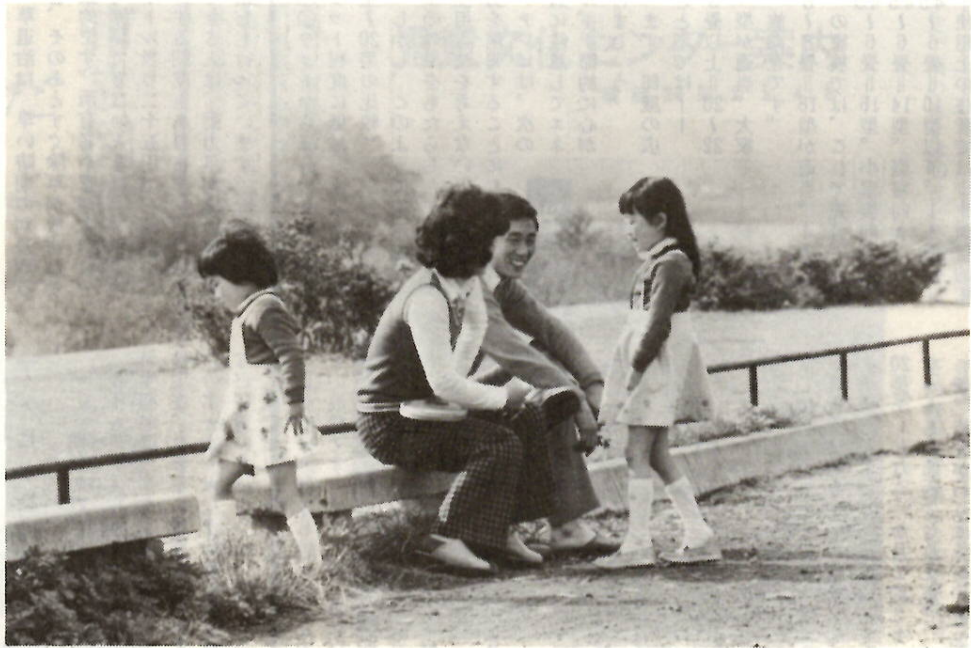
「ママ、何話してるの？」数島河川緑地には家族づれの語らいの姿もみられます

○：さて、五月の前半は、メーデー（1日）八十八夜（2日）憲法記念日（3日）子どもの日（5日）と続き、ゴールデンウィークもやってきました。例年、四月下旬から五月上旬にかけて、民族の大移動といわれるほど多くの人が旅行に出かけましたが、オイルショック以来、観光旅行は低調とかひと頃の金銭多消費型から最近では時間多消費型にレジャーが変わってきているそうです。 ○：ここ、利根川河川緑地には緑の風を頬に受けて、家族づれ、グループづれの人たちが「さわやか五月」を満喫しています。