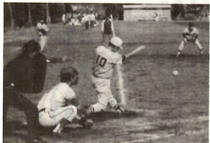
球音ひびく——いよいよ野球シーズン

てきてください。 □スポーツ教室「軟式庭球・家庭婦人コース」 市教育委員会と軟式庭球前橋支部の主催で、5月9日と16日の二日間、午前9時から正午まで、市内の家庭婦人を対象に「軟式庭球教室」をひらきます。会場は市宮庭球コート（三保町）を使い、募集人員は五十人です。参加料は無料ですが、ラケット、ボール、テニスシューズは、受講者が用意していただくことになります。希望者は5月8日正午までに市教育委員会体育課（電話32局六五三九）へ申し込んでください。 □家庭婦人スポーツ教室「硬式庭球コース」 市庭球協会主催、市教委後援で