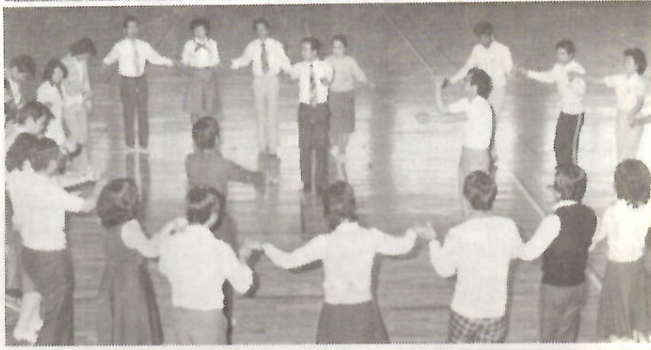
フォークダンス講習会