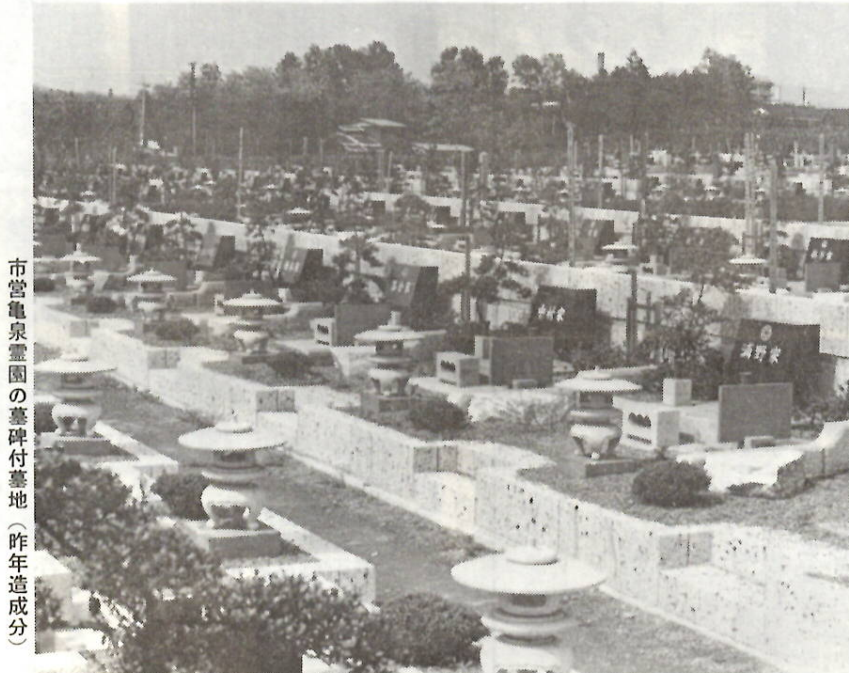
市営亀泉霊園の墓付墓地(昨年造成分)

◆ 広瀬川、桃木川をはじめ、小さな流れまで、ゴミを捨てる人がなかなか絶たない。広報紙をはじめ、いろいろな注意をうなが