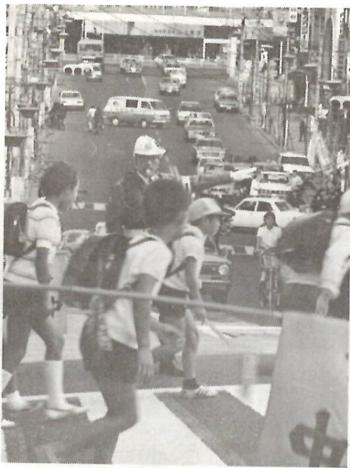
子どもにも、交通ルールを身につけさせて

「交通戦争」といわれる毎日。いつ、どこであなたや家族の身にふりかかってくるか知れない交通事故。万一の場合に備える交通災害共済は、わずかな会費を出し、あつて、交通事故で亡くなったり、ケガをされたかたに見舞金を支払う制度です。六月三十日まで一年間の共済期間が満了、七月一日から新たに契約が更新になります。その申込み受付けが六月十日からはじまります。今までの加入者は継続加入の手続きを忘れずに。未加入者は、この機会にぜひ加入しましょう。