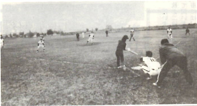
勤労者ソフトボール大会

●勤労者ソフトボール大会 ●トレーニング講習会 ●フォークダンス初心者講習会 ●スポーツ教室弓道コース