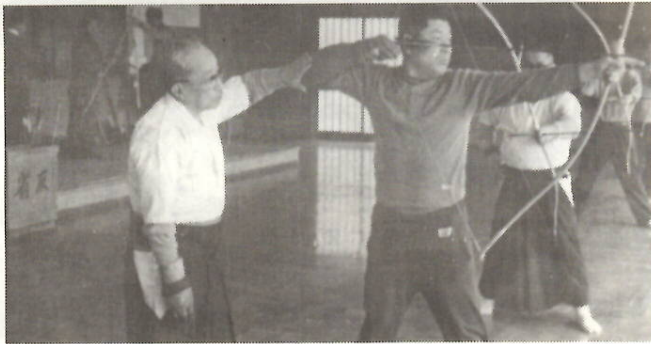
スポーツ教室弓道コース