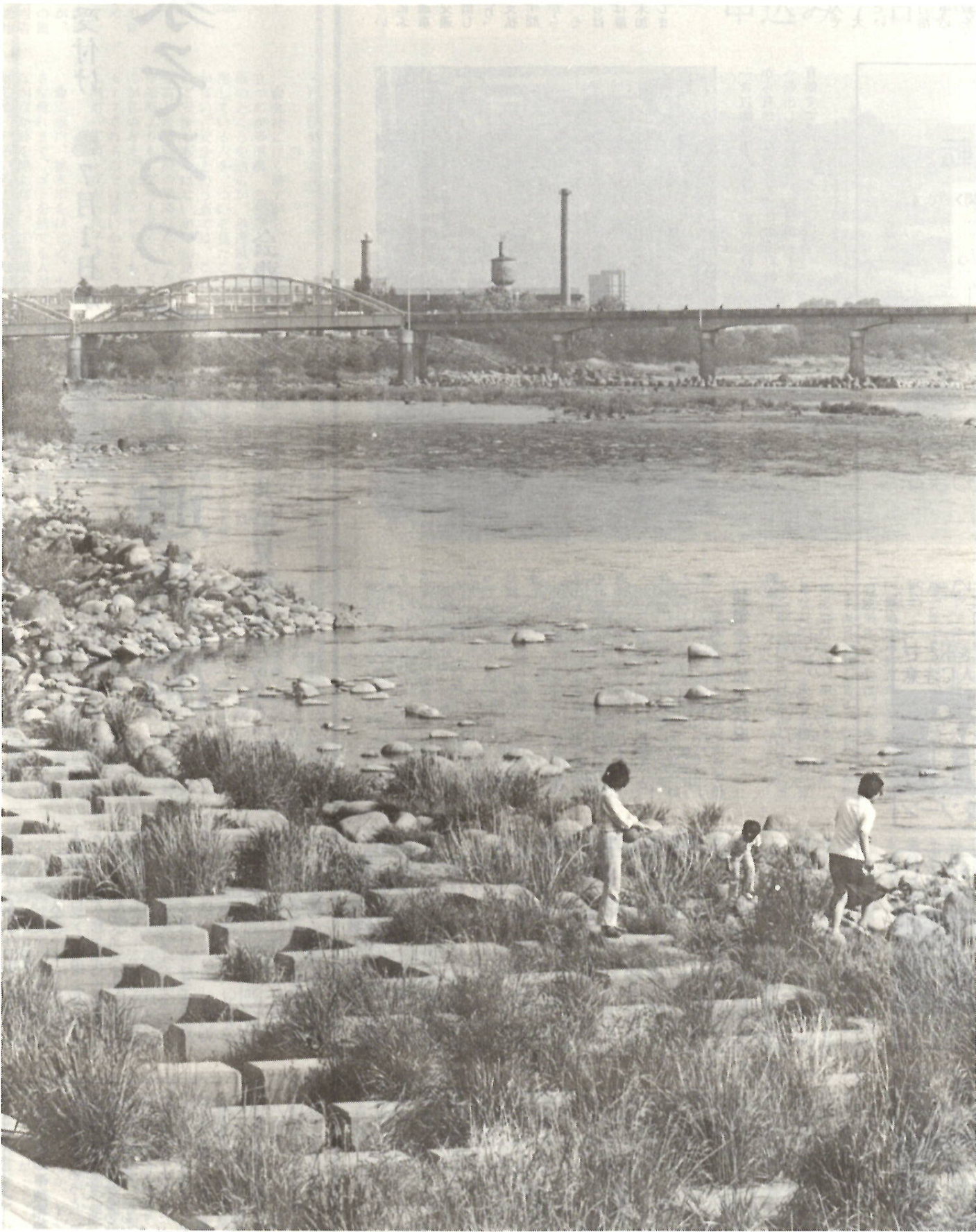
清流いつまでも——利根の川辺を散歩する親子連れ。前方に見えるのは大渡橋。