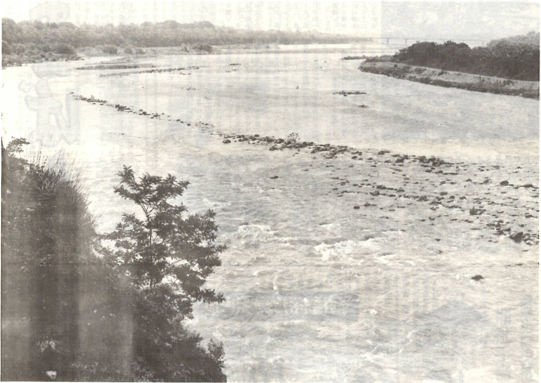
中央大橋畔から利根の上流を眺めると、対岸は総社地区のアカシヤ林が、梅雨空にけむって見える。遠方の橋は大渡橋。