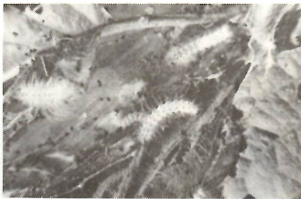
アメリカシロヒトリの幼虫

アメヒトの幼虫は、発生当初、一枚の葉に巣を作り、この中で約三百〜七百匹がひとかたまりになって、葉を食い荒らしています。アメヒトの防除は、この時期に葉を摘みとるのが、最も効果がありますから、大切な緑を守るため、市民一人ひとりが自主防除を行ってください。