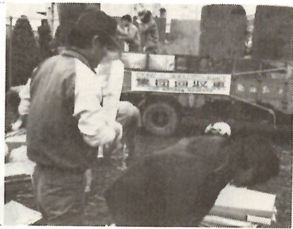
再生利用できるゴミの集団回収

有限な資源を再生利用により活用するため、集団回収をすすめるよう。毎日市内から出るゴミについて調べてみると、役立つものが意外に多くあります。ゴミは捨てる以外に道がない、という従来の考え方を、「ゴミを生かす」という考え方に切り替えて、見直していただきたいと思います。輸入資源に多くを依存しているわが国では、特にこのことが必要になってきます。