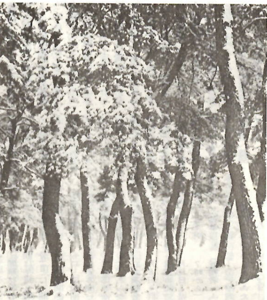
敷島公園の松林の雪景色—この奥に朔太郎詩碑がある

※詩碑・史跡めぐり 遙かな谷川岳が新雪に輝き、赤城おろしが吹き荒ぶ。きびしい冬の訪れである。 小春日和には、郷土の六詩人の詩碑や東の奈良ともいわれる古墳群を多くの人々が訪れ、静かに詩情にふれ、あるいは古代の史跡に親しんでいる姿も見られる。 ※ウインタースポーツと釣 赤城山頂の大沼が全面結氷し、粉雪が降り、山頂はスキー、スケート、わかさぎ釣りのメッカとなり、若人たちが釣人で大にぎわいとなる。 ・小沼天然スケート場(12月下旬〜3月上旬)・大沼天然スケート場(12月中旬〜1月下旬)・赤