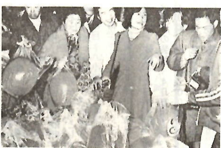
45万人の出入を呼ぶだるま市

※土産の三大まつり □日本一のだるま市 毎年1月9日、本町通りを中心に開かれる前橋の「初市」は、出店数千二百、にぎわいの華やかなことは日本一といわれる。三百六十年の伝統を持つこの初市は、別名「だるま市」と呼ばれ、延べ四十五万人の出入で、終日にぎわう。