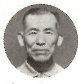
一、二年は守られても、結局立消えになっ てしまう心配が残ります。

円でお返しなしを実行しています。ただ、親戚は干渉しないということです。（下長磯町・農業・80歳）