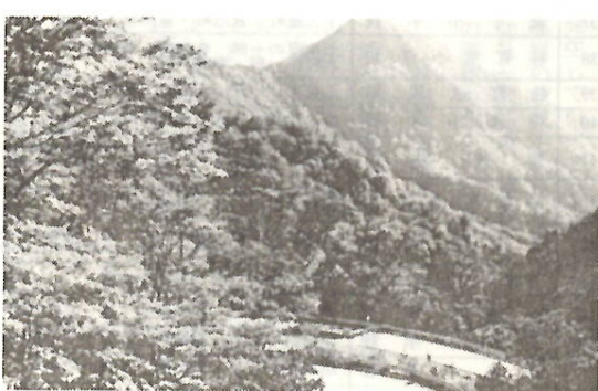
紅葉の赤城白樺ライン

城第一・第二・第三スキー場(1月上旬〜3月上旬)・わかさぎ釣り(12月下旬〜3月上旬)