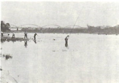
利根川の鮎釣り—中央大橋畔

※すがすがしい利根の川辺 むくむくと浮かぶ夏雲のもとで、どこからともなく蝉の声が聞こえてくれば、もう夏だ。利根川に若鮎を追う釣人の無心の姿は、一幅の絵をかもしだし、夏の風物詩となっている。川辺のかれんな月見草の花が涼を求める人々の目を惹き寄せ、市民プールの河童たちのはしゃぐかん高い声が、川風に乘って連日聞こえてくる。