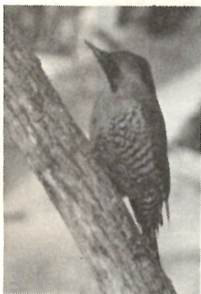
樹間のアオゲラはなかなかとらえにくい

キツツキの名の通り、木の中の虫を探するため、クチバシが強い。舌も二倍位に長く伸びる。その舌の先には、逆さのトゲがいくつもついている。虫を穴の中から出すのに都合よくできている。 足の指も、前後に二本ずつ分かれていて、これで幹をつかみ、強い尾を支えに垂直に幹をのぼったり、あと戻りをします。 野鳥は、一般に春になるとメスを呼んだり、巣を守ったりするためにオスはさえずります。アオゲラはさえずりがなく、木の穴などの近くをクチバシで叩き、音を響かせ求愛の動作をする。これをドライミングと呼んでいる。