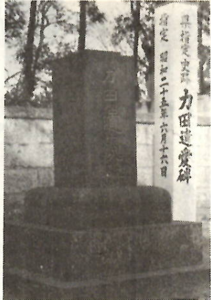
力田 遺愛 碑

教育委員会では、市内の各地や各家に残る民具、農具など、民俗文化財を対象とした調査と収集をはじめました。 市内の古い家々には、私たちの祖父母をはじめ祖先たちが、衣食住など日常生活に使った、色々な用具や農具がたくさんありました。