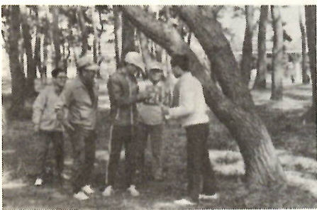
次はどの方向かな

背にはナップザック、胸にゼッケンをつけ、トレパン姿で、地図と磁石を頼りに敷島公園周辺を歩くオリエンテーリング――。市教委・市体育協会の主催、体育指導委員会、オリエンテーリングクラブが主体となって、三月六