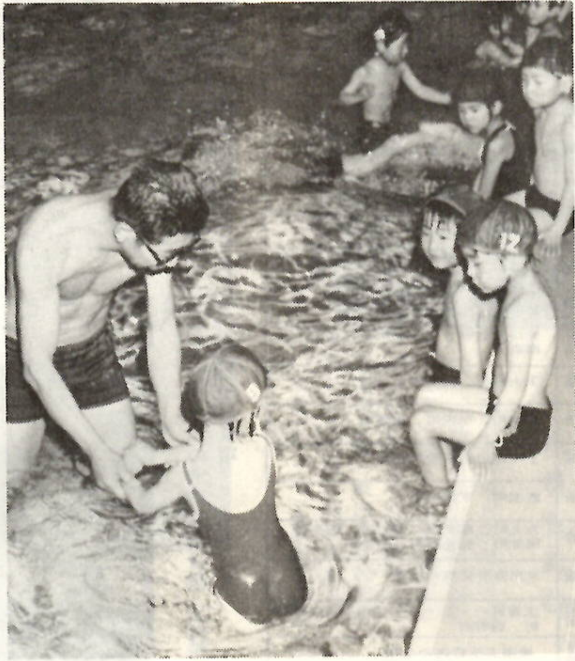
早く一人で泳げるようになりたいな

【申込期間】2月16日から21日まで（六日間）午前10時から午後5時まで温水プールへお出かけのうえ、申し込んでください。（電話での申し込みはできません） 【抽せん会と発表】各コースとも定員を超えた場合は、2月25日午前10時から抽せん会をひらき、午後1時に、温水プール前に掲示して発表します。 【受講手続き】2月25日午後1時から2月28日午後5時までに手続きを済ませてください。28日までに手続きのない場合は、無効となります。――受講手続きのとき、受講生の身長、体重、胸囲、泳力を書き込んでいただきます。付添を希望するかたは、受講生と同額の経費が必要です。 【指導員】温水プール・トレーニングセンター専任指導員が担当します。