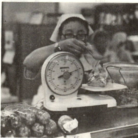
ハカリはいつも正確に――。

ことし第一回の「ハカリ定期検査」を行います。該当となるのは取引用や証明用に使っているハカリが対象です。たとえば①商店、工場など営業用②病院、薬局の調剤用③病院、保健所、学校などの身体検査用④農家で使う野菜などの出荷用⑤官公庁での納品検収用、自動車の車検用などに使われるハカリです。最寄りの会場で、必ず受けてください。