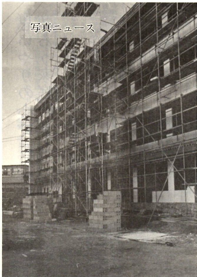
旧元総社中学校地に建設中の元総社南小学校