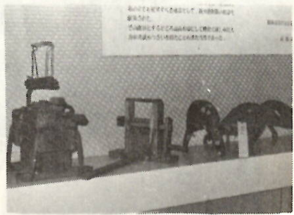
教育資料館に展示されている農具など