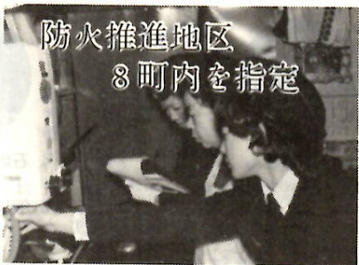
防火推進地区 8町内を指定