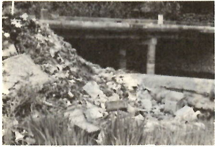
このゴミ捨てても心ない一部の人が……