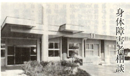
心身障害者福祉会館

け付けは、市社会福祉協議会（市役所三階、電話24局一一一内線二二七）で行っています。 お年寄り専用居室 増改築資金 融資あっ旋と利子補給 市では、今年度から六十歳以上のお年寄りと同居する世帯で、お年寄りの専用居室を増築または改造しようとする人に、資金の融資