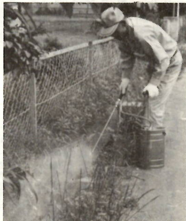
汚れた溝は蚊・ハエのすみか

市では、蚊、ハエの「すみか」を消毒する「夜間屋外薬剤散布」を、七月二十九日・八月十二日・八月二十六日の三回実施します。当日が雨の場合は、翌週の金曜日に行います。 実施区域は旧市域全域（両毛線以南を除く）で、作業は午後十時頃からはじめますが、区域によっては、多少時間が異なります。 使われる薬は「スミチオン粉剤（一・五％）」です。 ご家庭では、次のことにご注意ください。 ①屋敷内の金魚ばち、池などにはビニールや新聞紙で覆いを。 ②鶏舎、家畜舎などにも覆いをし、エサ箱などは室内に入れてください。