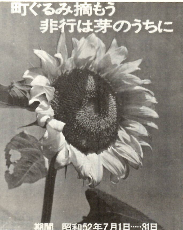
期間 昭和52年7月1日……31日 「地域社会における青少年非行の防止、を重点目標に全国的にくりひろげられる社会を明るくする運動」。

最も悲惨な住宅火災を防止するため、住宅の密集している町内を「防火推進地区」に指定し、出火防止のための防火診断や防火意識を高めるための防火座談会などの催しを行い、町ぐるみの防火対策を進めています。 今年度は、千代田一・二・三・四・五丁目、表町一・二丁目、本町二丁目の八町内を指定しました。 この防火推進地区では、今後順次防火診断や防火座談会などの催しをお知らせしますから、積極的な協力をお願いします。