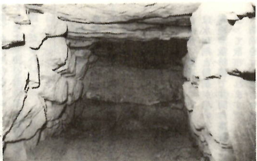
前二子古墳の石室

四季の変化に富みながらも比較的湿潤な日本では、石造構築物は少ない。その中で横穴式石室は、一種の石造構築物と見られる。特に大きな石室があるいはきれいな石室は、その感じが強く、前二子古墳の石室もその一つである。 この古墳は国道五〇号線を東へ進み、石山の十字路を北上すると、右手に見えてくる大室小学校の北東、西大室町二子山二六五九番地を中心とした地域にある。 古墳の墳丘は前方後円墳で、全長九三メートル、前方部幅六二メートル、後円部幅七二メートル、前方部高さ一二メートル、後円部高さ一三メートルあり、墳丘の外周には周濠がめぐり、その外側の南では、円筒埴輪と周堤が確認されている。埋葬主体部は明治十一年三月、村民により発掘され、後