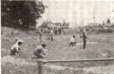
二子山公園の草刈りをする青年たち

おとなの背たけはとも伸びた雑草を、団員のみなさんは動力草刈機やカマで刈り取り、数時間で広い古墳もきれいさっぱり。古墳の南側の二子山公園も同時に。