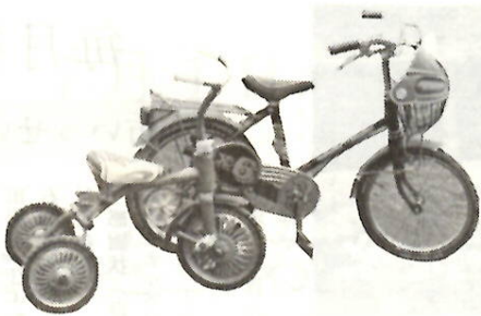
もし、いらなくなったら