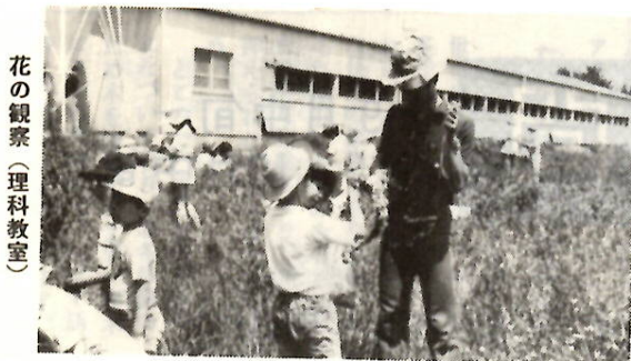
花の観察(理科教室)