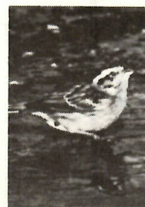
水浴をするホオジロ

茶褐色をしています。尾はやや長 めで、飛ぶときに尾羽の両端が白 く見えるのも特長です。 地鳴きは、「チッチ」と二声で、 同じ科の姿かたちのに似ている鳥た ちと区別するのに役立ちます。 さえずりは、「チッチ、チルチ ルチル、チリン」と、鳴き声の 最後に鈴の音が入るような感じで す。 ことばで表すと「一筆啓上仕り 候」と鳴くといわれています。 明るい林、公園、畑などで見る 機会が多く、さえずるときは、電 線やアンテナ、樹木などが多いよ うです。一定時間さえずると移動 し、次の目的地で同じようにさえ