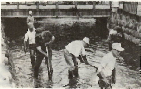
佐久間川の清掃(6月8日)

最近、夜間での歩行者や自転車の交通事故が増えています。原因はいろいろありますが、自