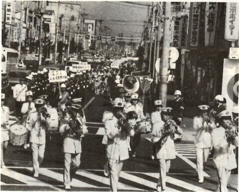
交通安全を呼びかけるパレード

九月二十一日から三十日まで、全国いっせいに「秋の交通安全運動」が行われます。ことの重点是、「歩行者・自転車利用者、特に子どもと老人の交通事故の防止」「シートベルト着用推進」「夜間における交通事故の防止」「ゆとり走り運動の定着化・ゆとり合いマナーの徹底」の四つ。本市でも、市交通対策協議会が中心となって、各種行事が実施されます。みなさんで、正しい交通ルールの実践を習慣づけ、交通事故を防止したいものです。