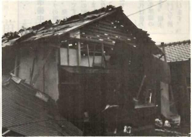
ガス漏れ爆発のため、新しい家も一瞬に……。

プロパンガスは正しく使えば、たいへん便利な燃料であるため、多くの家庭で使われています。しかし、ちょっとした取り扱いの不注意によって、大惨事もときどき起こっています。ガス事故の主原因は点火ミス、ホースの老化、コックの締め忘れなど、い