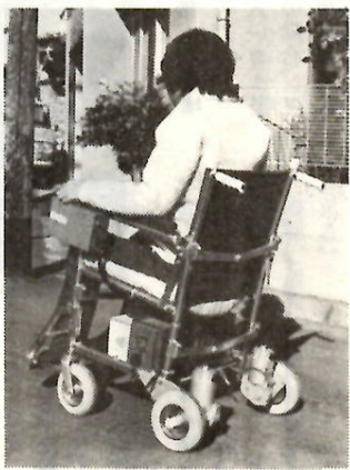
操作が簡単な動力付車いす

市では、在宅重度身体障害の人を対象に、日常生活に必要とする各種用具の給付を行っています。給付は、前年の市民税非課税世帯については無償で、それ以外のかたは本人の負担金が必要です。給付する用具は、次の十一種類です。 ①浴そう②障害者が使える洋式バスまたはこれに準ずるもので、実用水量百五十リットル以上のもの。対象は下肢または体幹機能障害一、