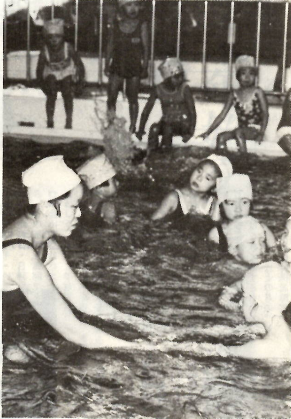
練習にはげむチビッコたち。

温水プール・トレーニングセンターでは、五十二年度第三回水泳講習会を、十一月一日から三月三十日までの三か月間ひらきます。今回の対象は、幼稚園年長組コースから婦人コースまでです。なお、幼稚園年長組コースについては、付添者が必要です。受講希望のかたは、次により申し込んでください。 □申込み期間 十二月八日(木)から十一日(日) 午前十時から午後五時まで、温水プール・トレーニングセンターで。 □抽せん会と発表 各コースとも定員を超えた場合は、十二月十四日(水)午前九時三十分から抽せん会を行います。結果については、十二月十五日(木)午前十時にセンターに掲示発表し