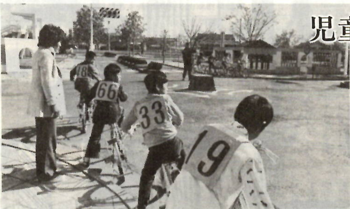
自転車の安全な乗り方を練習する桂壺小の五年生。

日常生活に一番関係の深い潮のみちや月のみちかけは、どうして起こるのでしょうか。みんな考えてみましょう。物語は「三日月をつくれ」です。