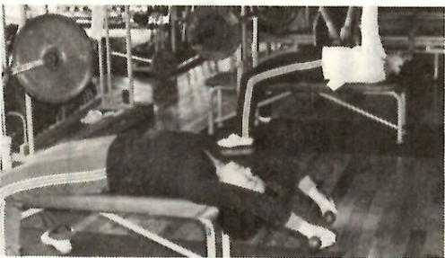
美容と健康のためと汗をながす婦人たち。

温水プール・トレーニングセンターでは、市民のみなさんの運動不足を解消し、美容と健康を図るため、三十代から六十代までのかたを対象にトレーニング講習会を開きます。 □受講資格 三十代から六十代までの男女。