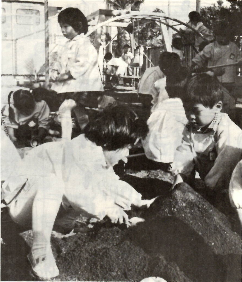
みんな仲よく砂遊び（市立第3保育所で）。

市では、昭和五十三年年度の市内の保育所（園）入所申請を次のとおり受け付けます。入所を希望するお子さんをおもちのかたは、お申し込みください。この申し込みは、現在入所中のお子さんの場合も手続きが必要です。