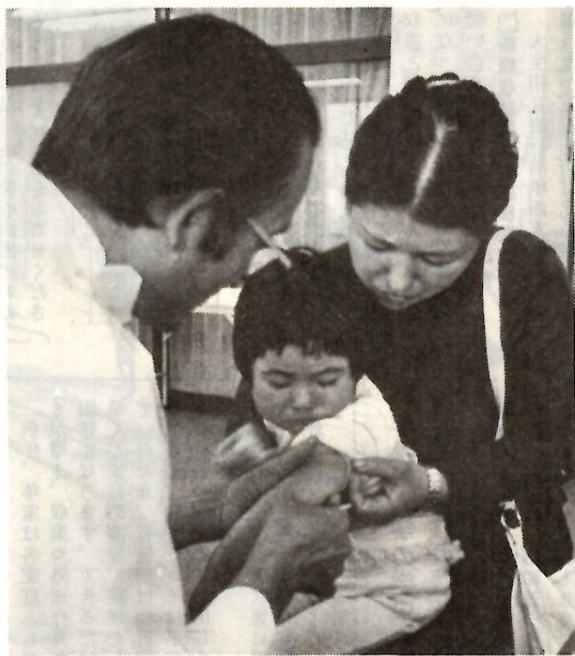
予防接種センターで

□該当者 満三歳児で、今までに一度もBCG予防接種を受けていない子ども。なお、三か月以上二歳までの乳幼児は来年度以降に機会がありますから、次回に受けてください。今までに一度BCG予防接種を受けている人は該当しません。 □注意事項 ①ツベルクリン反応検査を受けるときは、予防接種手帳の該当する問診票のきりとり線から上の部分に記入し、それを切りはなして受け付けに出してください。②ツベルクリン判定およびBCG予防接種を受けるときは、予防接種手帳の該当する問診票の残りの部分に記入してください。③接種前に健康状態をたずねますから、責任をもって答えられる人が付き添ってきてください。④母子手帳は忘れずにお持ちください。