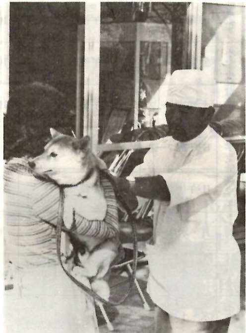
狂犬病予防注射(大根根町公民館)

飼い犬(生後91日以上)は、年一回の登録と、春・秋二回の狂犬病予防注射が法によって、飼い主に義務づけられています。 市では今年度最後の登録と狂犬病予防注射を次の日程で実施しますので、必ず受けてください。