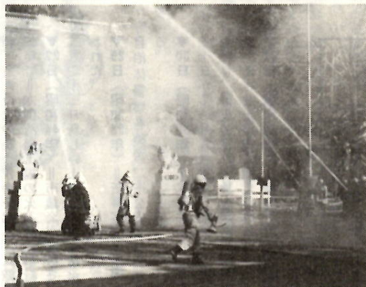
文化財に対する消防訓練（二宮赤城神社で）

昭和二十四年一月二十六日、世界最古の木造建築、法隆寺金堂が全焼し、有名な壁画を焼失しました。「文化財防火デー」は、この日を反省し、大切な文化財を火災から守る意味から昭和二十九年に定められました。私たちの前橋は、古くから栄え