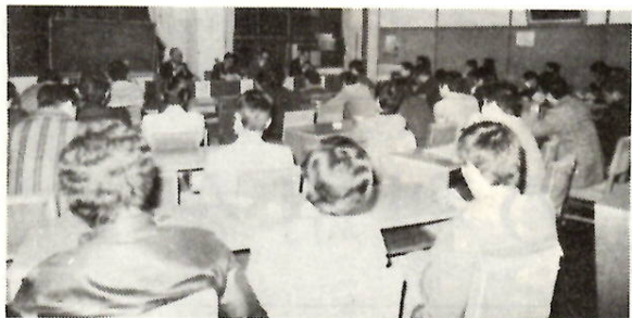
講座はいつも好評—。