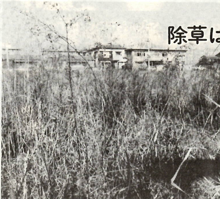
これからは火災の発生しやすい時期。雑草は早めに刈り取りを——。

寒さが厳しく、空気が乾燥し火災の発生しやすい時期になりました。あき地の所有者（管理人）でまだ除草の済んでいないかたは、早急に刈り取ってください。なお、自分でできないかたは、市で代行（二平方メートルあたり三十円）する制度がありますから利用してください。希望者は環境衛生課（電話24局一一一内線二八三）へ申し込んでください。 また、あき地の環境管理の一方として、今から家庭菜園などの有効利用を考えておくこともよいでしょう。