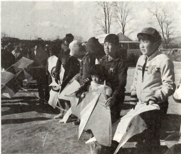
高く上がってくれるといいな。（敷島河川緑地で）