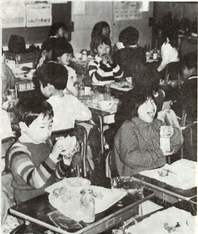
楽しい給食の時間（永明小学校で）