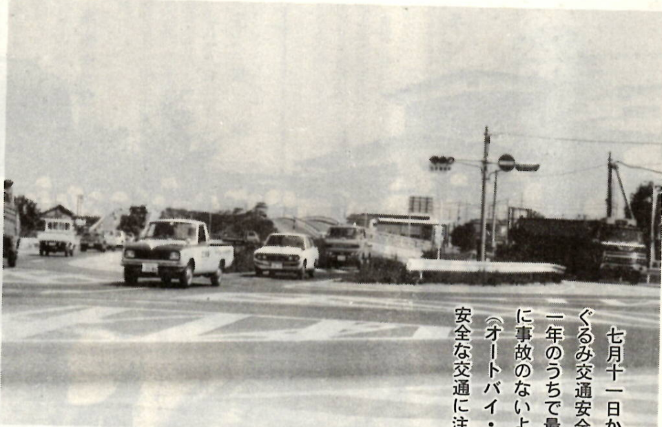
右折専用道路と信号機(写真中央)が設置された駒形バイパス小原交差点

ぼくは、昭和五十二年四月に、財団法人「佐藤交通遺児福祉基金」(群馬県庁内交通対策課内)から発行された、交通遺児作文集「やさしかったおとうさん」に掲載されたものです。関係者のご好意で転載させていただきます。市民のみなさんのご感想をお寄せください。(広聴文書課広報係)