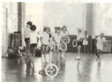
うまく入るかな(朝倉児童館で)

図書室などがあり、卓球台、とび箱、トランポリン、大型積み木の遊具や、オルガン、映写機、図書などの教具がそろえてあります。また敷地内には、ブランコ、砂場