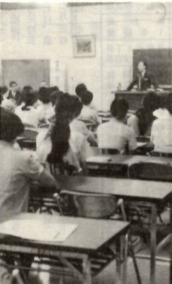
研修をうけるものあるに...

金をいかにむだなく使い、必要な金を最も安く調達することは、企業経営において、重要な仕事です。単に金が不足するから融資を受けるのではなく、事業計画に見合う融資を受けることがたいせつです。 市では、いつでも中小企業のみならず、経営・金融相談を実施しています。 ○詳しくは、商政課（電話24局一一一内線二四九）へお問い合わせください。