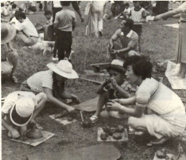
太陽の下で親子の会話が続く日曜日の午後