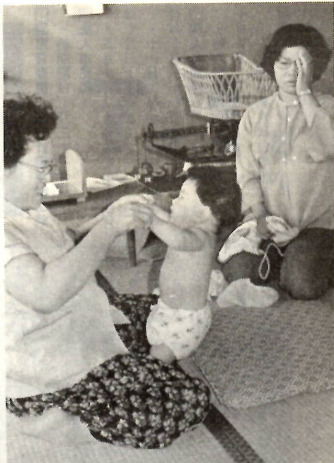
さあ、赤ちゃん体操ですよ（下川瀬公民館で）

相談も行います。時間は午前が十時から十一時三十分、午後が一時から三時までです。ただし文京町四丁目公民館は午後のみです。