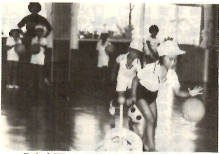
うまく回ってきてね (朝倉児童館で)