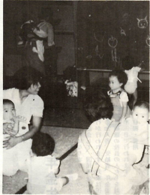
子供の健康管理やしつけは親の役割

(火)までの毎週火曜日、午前九 時三十分から十一時三十分までの 二時間(計十一回、二十二時間) 乳幼児家庭教育学級を開きます。 学習内容は、乳幼児の体の特徴 や発達、健康管理、遊びと生活、 しつけと親の役割——など。