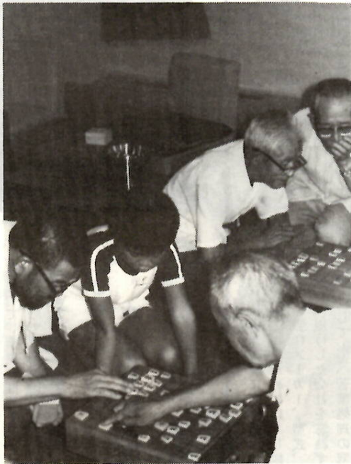
おじいちゃんがんばって(老人福祉センターで)

九月十五日は「敬老の日」。この日はお年寄りの長寿を祝い、明るく健康な生活を願うとともに、いたわり合いの気持ちを育てる日でもあります。市ではこの日を祝って、七十五歳以上のかたに社会福祉協議会を通じてお祝い品を贈ります。また、各地区ごとに記念行事を行うことになっています。なお、市社会福祉協議会では、八十八歳(米寿の祝)と七十七歳(喜寿の祝)を迎えたかたにお祝い品を贈ります。