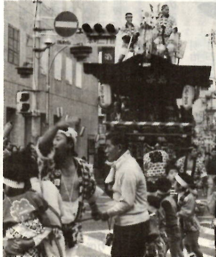
太鼓や笛の響きがまつりムードを盛り上げる

【大人みこし】各町内、商店街、事業所などから、勇壮な大人みこし、女性みこしが参加し、市内中心部をのみながら行進します。